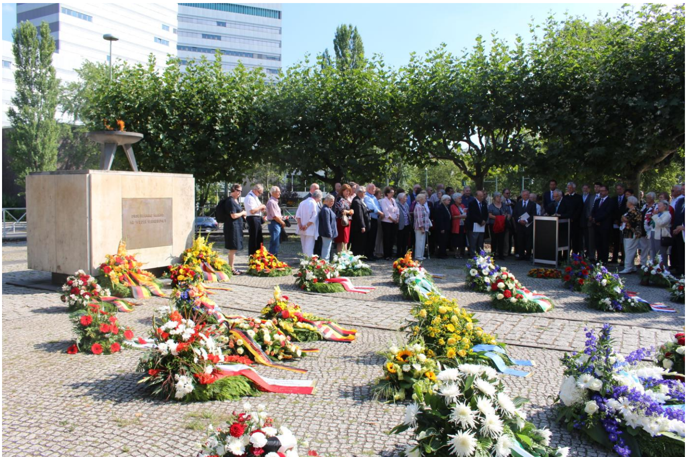
Kranzniederlegung zum Tag der Heimat am 29. August 2015 auf dem Theodor-Heuß-Platz in Berlin-Charlottenburg – auch der Kranz des Bundesvorstandes der LM Westpreußen e.V. fehlte...