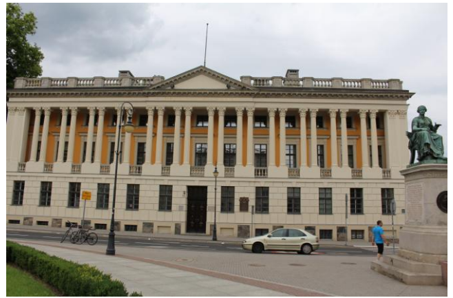
Die Raczyński-Bibliothek (1822-1829 errichtet)