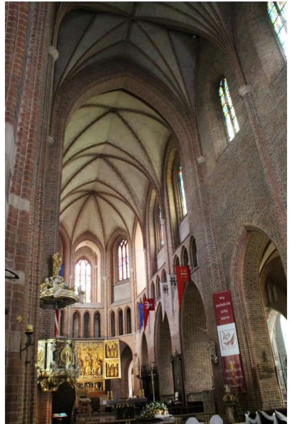
Die Goldene Kapelle in der Posener Kathedrale mit den Bronze-Standbildern von Caspar Daniel Rauch für die polnischen Herrscher Mieszko I. und Bolesław Chobry („der Tapfere“) (links) und Blick in das Hauptschiff der Kathedrale hin zu Kanzel und Altar