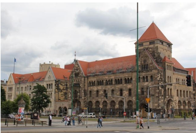
Die (ehm.) preußische Postdirektion in Neuromanik (Arch. Franz Schwechten)