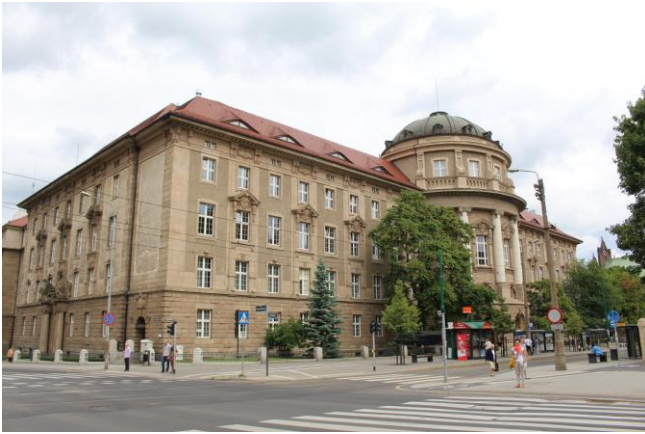
Das Gebäude der Preußischen Ansiedlungskommission (Neubarock 1908), heute Collegium Maius