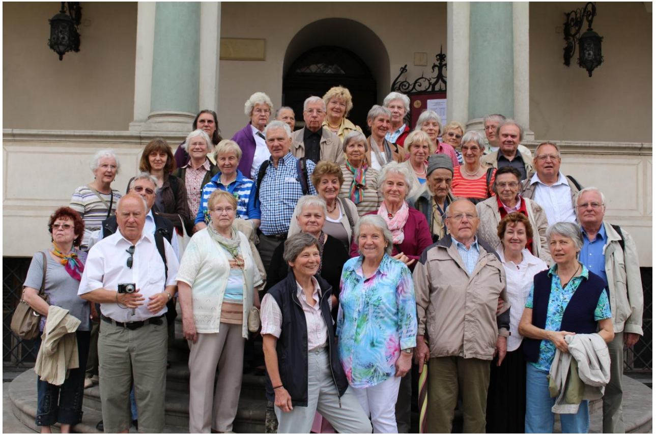
Teilnehmer der Tagesfahrt auf der Rathhaustreppe auf dem Posener Ring (oben), Westwerk der Posener Peter- und Paul-Kathedrale (unten links) und Hauptaltar aus Guhrau in Niederschlesien (unten rechts)