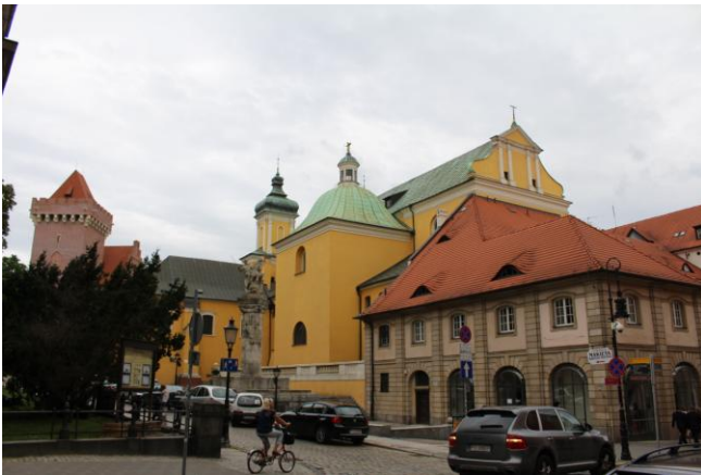
Blick auf Franziskanerkirche (errichtet 1674 -1728) und „Königsschloss“ (in Rekonstruktion) auf dem Przemyslaw-Berg / Góra Przemysława