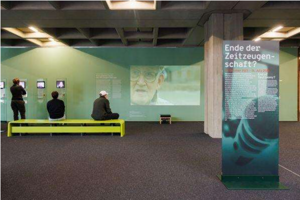
Abb. 2: „Eine gemachte Sache – das Zeitzeugeninterview“: Ausstellungssequenz zum „Making-of“ von Videointerviews

Mit der Präsentation von Videointerviews entspricht die erste Ebene auf den ersten Blick der gewohnten Präsentation von Zeitzeugenschaft in Ausstellungen. Die gewählten Momente durchbrechen jedoch die Routine: Sie zeigen das, was sonst weggeschnitten wird, etwa, wie ein Kameramann bei einem Dreh in der KZ-Gedenkstätte Flossenbürg einen Zeitzeugen abrupt unterbricht, weil er die Linse des Objektivs reinigen muss. Der Zeitzeuge steht, wartet, friert. Hier tritt die „Gemachtheit“ der Interviews deutlich zu Tage.