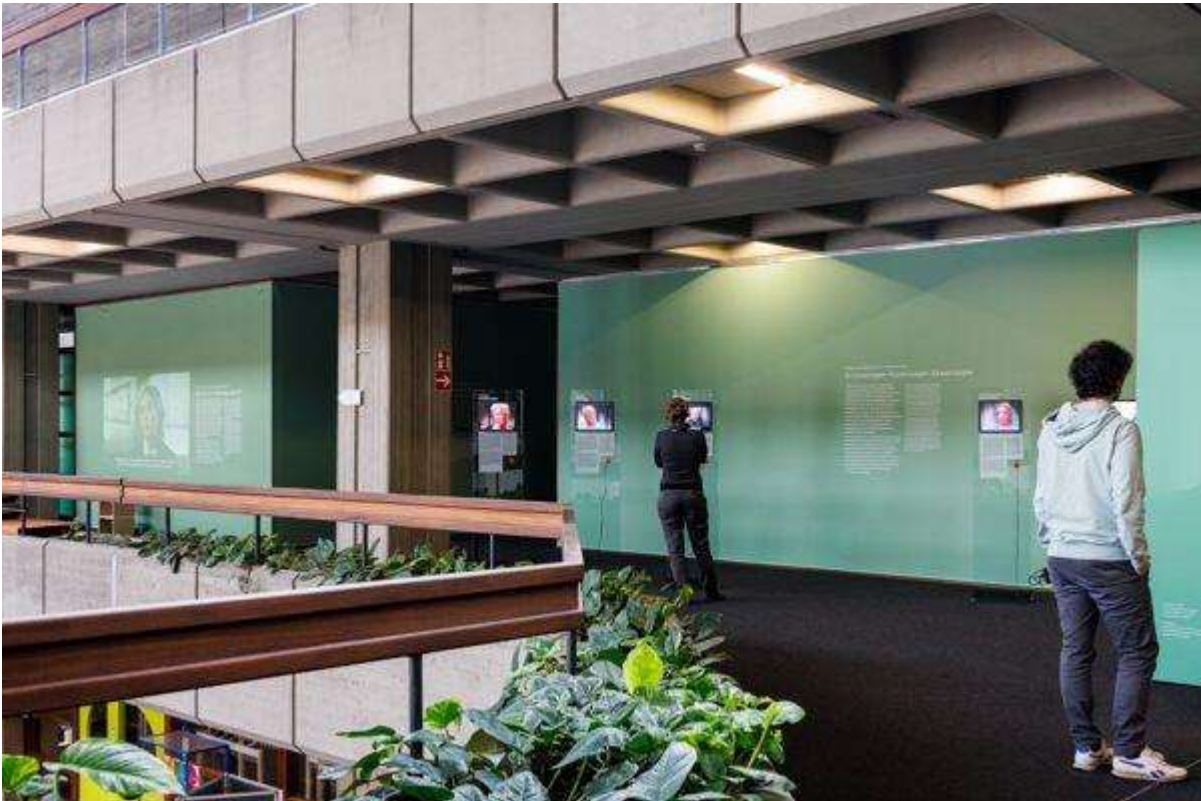
Abb. 3: „Erinnerungen – Erzählungen – Erwartungen“: Die drei Medienstationen zu den Leitbegriffen „Zumutung“, „Zeitabstände“ und „Auftrag“ stehen leicht versetzt. So verweisen sie auf den gesellschaftspolitischen Kontext der Interviews, der im Raum dahinter vertieft wird.

Leicht abgesetzt stehen die Medienstationen zu den Topoi „Zumutung“, „Zeitabstände“ und „Auftrag“. Hier verdeutlicht ein Interview mit Aleksander Laks (1927–2015), 2006 aufgenommen in der KZ-Gedenkstätte Flossenbürg, den Wunsch vieler Überlebender, denjenigen eine Stimme zu geben, die nicht mehr sprechen konnten: Der Vater des damals 16-Jährigen wurde im KZ Flossenbürg ermordet. Durch die Präsentation der Interviews anhand der herausgearbeiteten Erzählstrukturen gerät der zeitliche wie räumliche Kontext ihrer Entstehung allerdings in den Hintergrund. Für eine fundierte quellenkritische Einbindung der Videos in die Ausstellung müsste der zeithistorische Zusammenhang ihrer Aufnahme ebenso deutlich werden wie die Zeitgebundenheit in der Art und Motivation des Fragens.