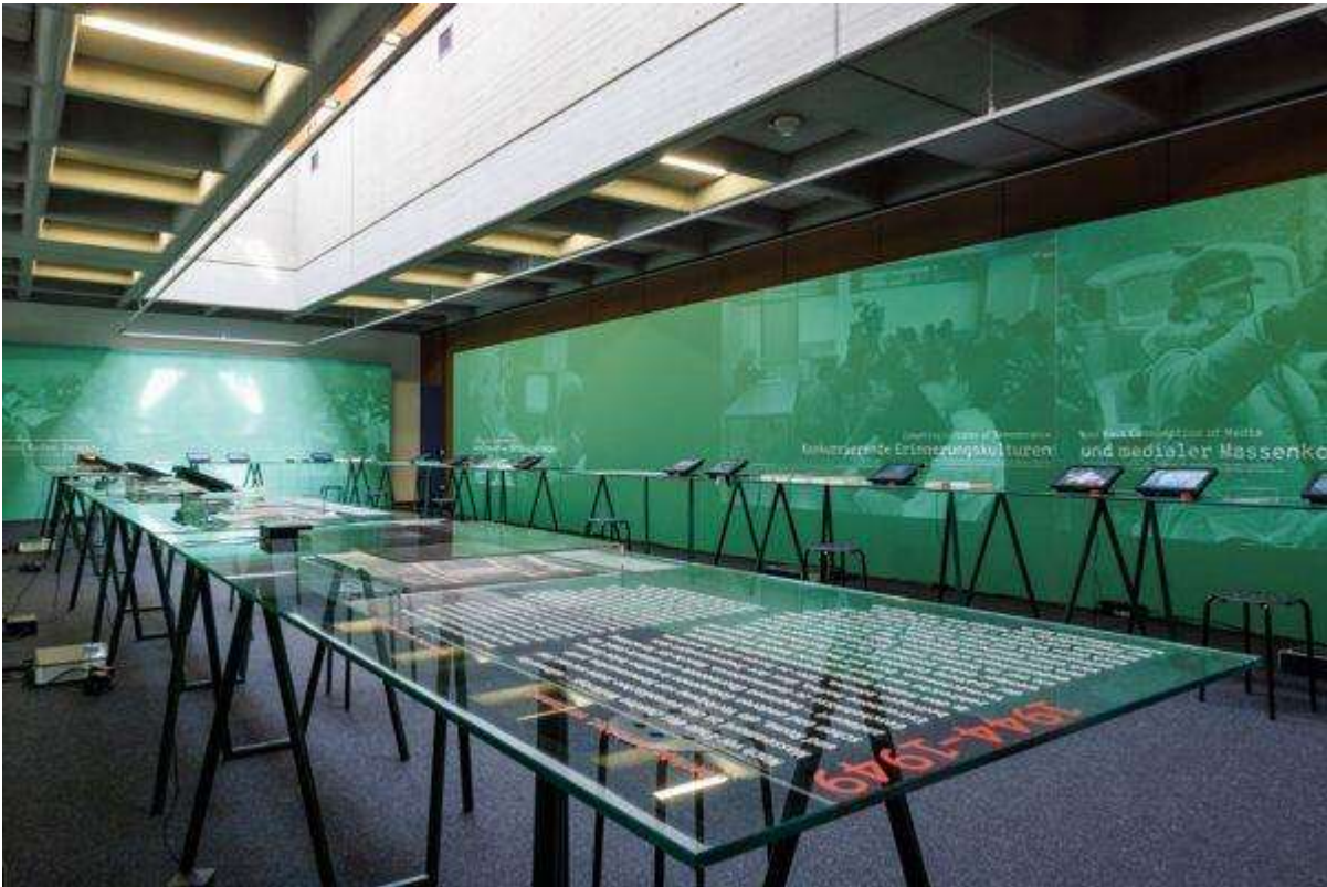
Abb. 4: „Vergangenheit, Gegenwart und Zukunft der Zeitzeugenschaft“: Der chronologische Teil ist in einem eigenen Raum in U-Form zu sehen.

Im ersten Abschnitt dieses Segments thematisiert die Ausstellung die in der Forschung lange Zeit vernachlässigten, durchaus zahlreichen Initiativen der unmittelbaren Nachkriegszeit. Anhand einer Anleitung für Zeitzeugengespräche sowie einer Fotografie aus Łódź wird die Arbeit der Zentralen Jüdischen Historischen Kommission vorgestellt, die im Nachkriegspolen über 3.000 Berichte von Überlebenden sammelte. Ein Blick auf das weitere Wirken der Survivor Scholars – etwa Joseph Wulf, der ab 1952 in West-Berlin zahlreiche Dokumentationen zum Holocaust vorlegte – hätte hier nicht nur Einblick gewährt in die Ablehnung, auf die Historiker wie er innerhalb der bundesdeutschen (akademischen) Geschichtswissenschaft stießen, sondern hätte auch die im Katalog anklingende Dichotomie zwischen Geschichtswissenschaft und Zeitzeugenschaft differenzieren können.