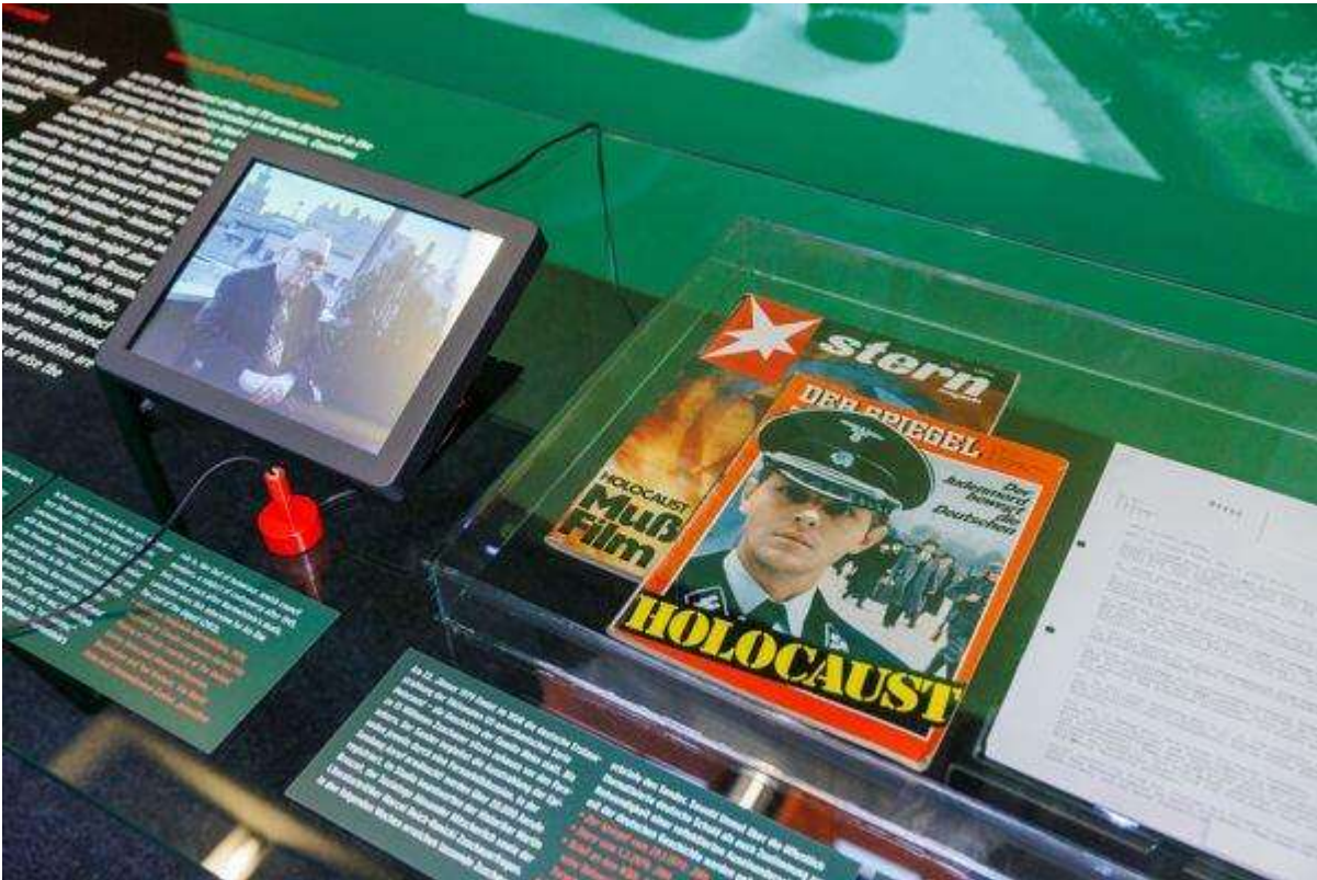
Abb. 5: „Neue Perspektiven, andere Erinnerungen“: Die veränderte Auseinandersetzung mit dem Nationalsozialismus, die sich in den Reaktionen auf die Ausstrahlung der US-amerikanischen Serie „Holocaust“ zeigt, wird in der Ausstellung anhand der damaligen Presseberichte sowie mit Zuschriften an den Westdeutschen Rundfunk (WDR) thematisiert.