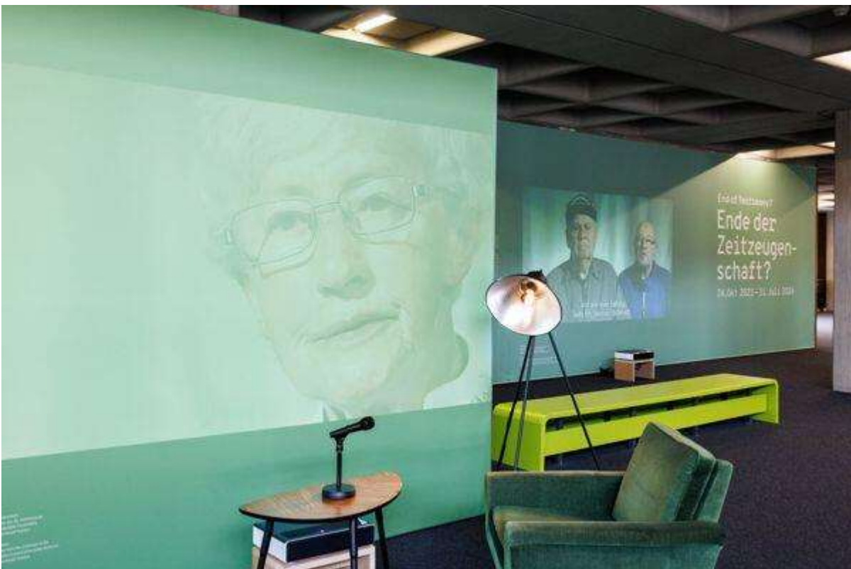
Abb. 1: „Ende der Zeitzeugenschaft?“ Einstieg in die Ausstellung in der Universitätsbibliothek Regensburg

Der Beginn der Ausstellung in der Regensburger Universitätsbibliothek – an einem Transitorium zwischen Bücherregalen, Seminarräumen und einem Café mitten im universitären Alltag platziert – zieht Besuchende wie zufällig Vorbeikommende mitten hinein in die Thematik: Eine Lampe, ein Tisch, ein Mikrofon, alles steht bereit für ein Zeitzeugeninterview. Ein Sessel lädt ein, sich zu setzen und das Gespräch zu eröffnen. Mit Hilfe von Videosequenzen, aufgenommen unmittelbar vor den Interviews, sind die Gesprächspartnerinnen und -partner an die Wand projiziert: stumm darauf wartend, gefragt, zur Zeitzeugin, zum Zeitzeugen zu werden.