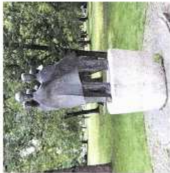
Foto: Vertriebenen-Denkmal im Kurpark Bad Cannstatt, an den Bodespaltzen ist der Teuf der Cherna angebracht

Kulturstiftung der deutschen Vertriebenen