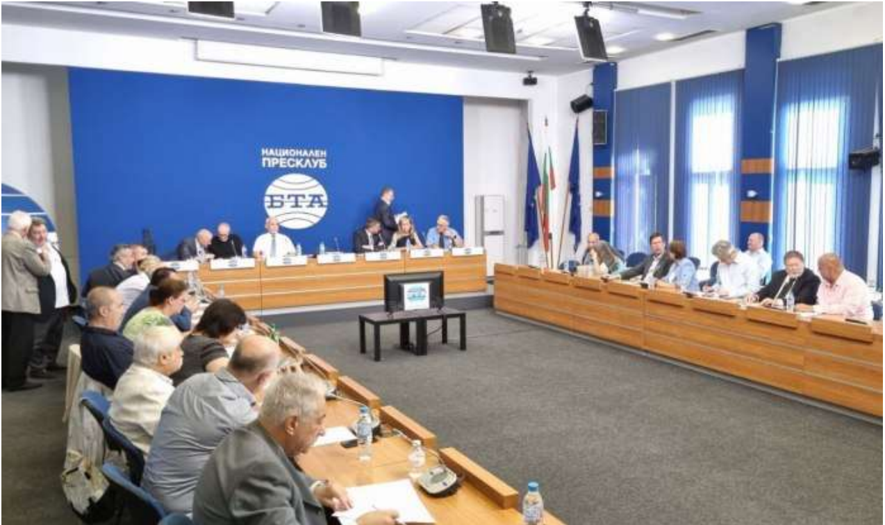
Pressekonferenz in Sofia

Nachdem sich die Bewegung seit 20 Jahren vor allem in Bulgarien stetig entwickelt hatte, sind mittlerweile Aktivitäten auch in anderen Staaten geplant worden.