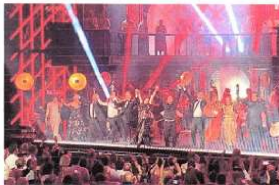
Schlusszene Babylon Berlin in Concert 13.09.2023

Vor allem die Auftritte von Meret Becker werden im Gedächtnis bleiben. Sie lieferte eine unglaubliche Performance ab, Gesang und Tanz, und wackelte mit dem Hinterteil, wie es Josephine Baker nicht hätte besser machen können, bloß ohne Bananen. Mit frenetischem Applaus wurde Max Raabe begrüßt, der Minimalist, der sich kaum bewegt, aber mit seiner Stimme den Saal zum Kochen bringt. Im Duett mit Meret Becker sang er den Klassiker „Ich küsse Ihre Hand Madame...“