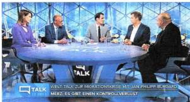
Screenshot WELT TV

Große Aufregung um die Zahnbehandlung fand auch in dieser Woche statt.