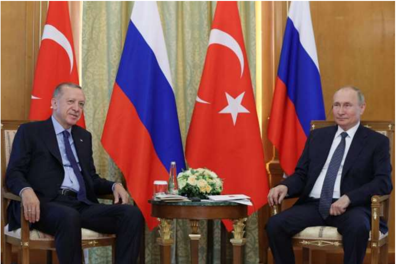
Putin und Erdogan beim Treffen in Sotschi.

Der Westen erwartete sich zweifellos viel vom Treffen der Präsidenten Russlands und der Türkei.