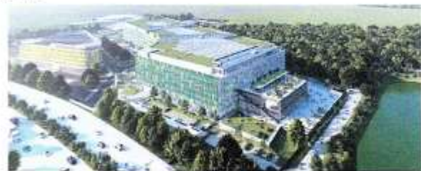
So wird der EUREF-Campus Düsseldorf 2025 aussehen.

Welche Ziele verfolgt die Innovationspartnerschaft, welche Projekt stehen im Vordergrund? Wie entsteht am Standort DUS der Mobilitäts-Hub für NRW? Welche Rolle spielen Wasserstoff und Sustainable Aviation Fuel auf dem Weg zum nachhaltigen Luftverkehr an einem der größten Airports in Deutschland? Welche Partner aus Wirtschaft und Wissenschaft treiben die Innovationen voran? Diese Fragen und viele mehr werden am 4. Oktober in München beantwortet und paperpress wird am 5. Oktober darüber berichten.