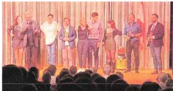
Verdienter Schlussapplaus für alle Beteiligten.

Man soll ja nicht immer damit kommen, dass früher alles besser war. Es stimmt aber leider sehr oft. Denn früher wurden die Programme der Stachelschweine im Fernsehen übertragen, was eine gute Werbung war und dem Theater sehr geholfen hat. Der Landesender rbb verspricht „ bloß nicht langweilen “ und langweilt seine Zuschauer mit immer wiederkehrenden „ die besten 30...was auch immer! “ Und die wenigen attraktiven und informativen Sendungen wie „ Thadeusz und die Beobachter “ verschwinden zum Jahresende vom Bildschirm.