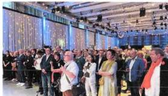
Blick in den Saal

verliert sich aber im ständigen Streit. Das so genannte Wachstumschancengesetz bringe gar nichts, es sei eine teure Paartherapie der Regierung.