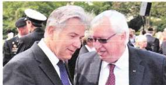
Luftbrückengedenktage 12. Mai 2011

Am 8. August 2014 beim DEHOGA-Sommerfest tanzte er vergnügt im Tipi-Zelt mit Gayle Tufts . Einen Tag später sickerte durch, dass er zum Jahresende sein Amt als Regierender Bürgermeister aufgeben werde.