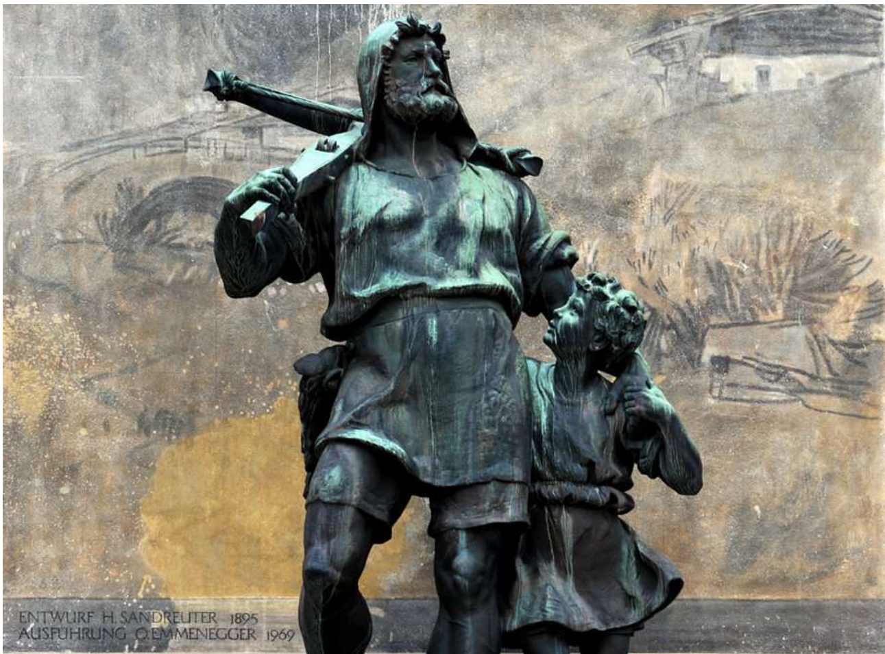
Telldenkmal mit Bronzestatue von Richard Kissling und Hintergrundbild von Hans Sandreuter in Altdorf (Kanton Uri, Schweiz)

Im Internet mitgehört und mitgeschrieben von Wilhelm Tell