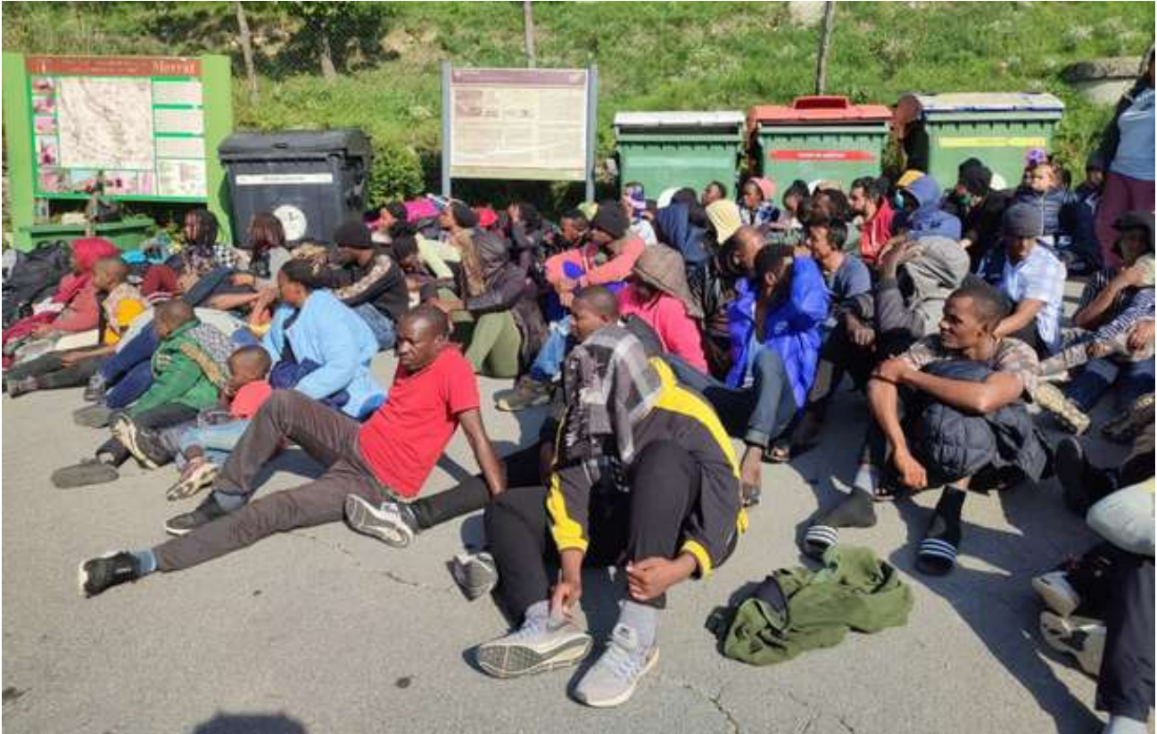
Illegale Migranten im slowenischen Istrien.

Auch Slowenien sieht sich in diesem Jahr mit einer Zunahme der illegalen Migration konfrontiert. Die konzertierte Aktion, Europa mit vorwiegend jungen Männern aus fremden Kulturkreise zu fluten, macht auch vor den Grenzen Sloweniens nicht halt. DEMOKRACIJA unser, Partner in der EUROPÄISCHEN MEDIENKOOPERATION schreibt dazu: