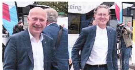
Gut gelaunt betreten Kai Wegner und Christian Gaebler die Baustellen.

Im laufenden Jahr sollen die Gesamtinvestitionen für Neubau und Bestand sogar noch zulegen und mit einem Plus von rund 19 Prozent erstmals die Grenze von zwei Milliarden Euro übersteigen. Angesichts von Klimawandel und Heizwende besonders erfreulich: Mit einem Plus um fast 64 Prozent auf 326 Millionen Euro sollen dabei die Modernisierungsinvestitionen besonders stark wachsen. Auch in den Neubau soll mit dann rund 1,3 Milliarden Euro erneut mehr investiert werden (+12 %).