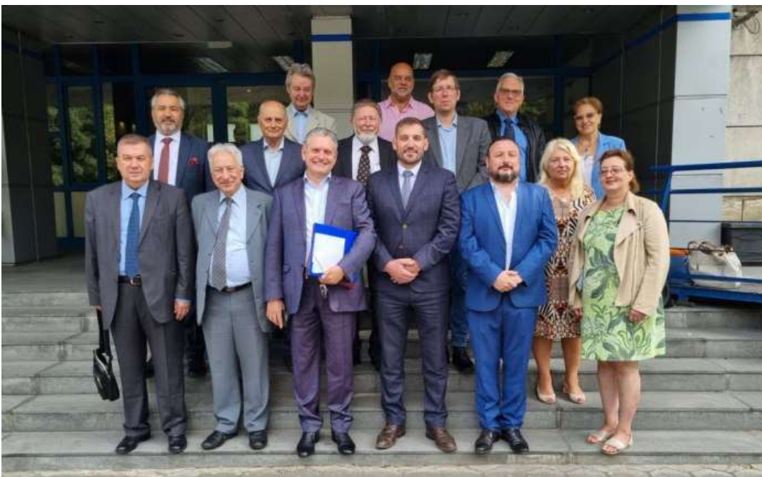
Internationale Teilnehmer am Russophilen-Treffen.- Bild: privat

Dieses Mal wurde der Event mit einem großen Fest für alle Teilnehmer verbunden. Dabei traf man sich auf einem riesigen Freiluft-Areal, das beinahe „Woodstock-Charakter“ versprühte.