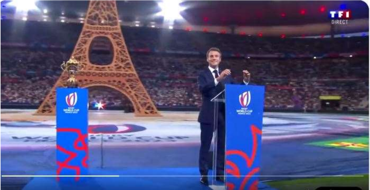
Macron bei Eröffnung der Rugby-WM.

Frankreichs Präsident Emmanuel Macron wurde bei der Eröffnungsfeier der Rugby-Weltmeisterschaft in Frankreich ausgebuht.