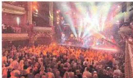
Theater des Westens 13.09.2023