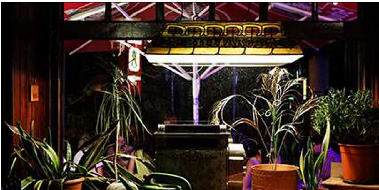
Zum Magendoktor, 2023, Filmstill aus Haze, Lace & Doppelkorn.