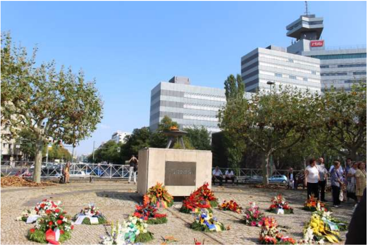
Jedes Jahr werden zum Tag der Heimat Kränze und Blumengebinde niedergelegt, denn „Diese Flamme mahnt Nie wieder Vertreibungen“. - Blick nach Westen.