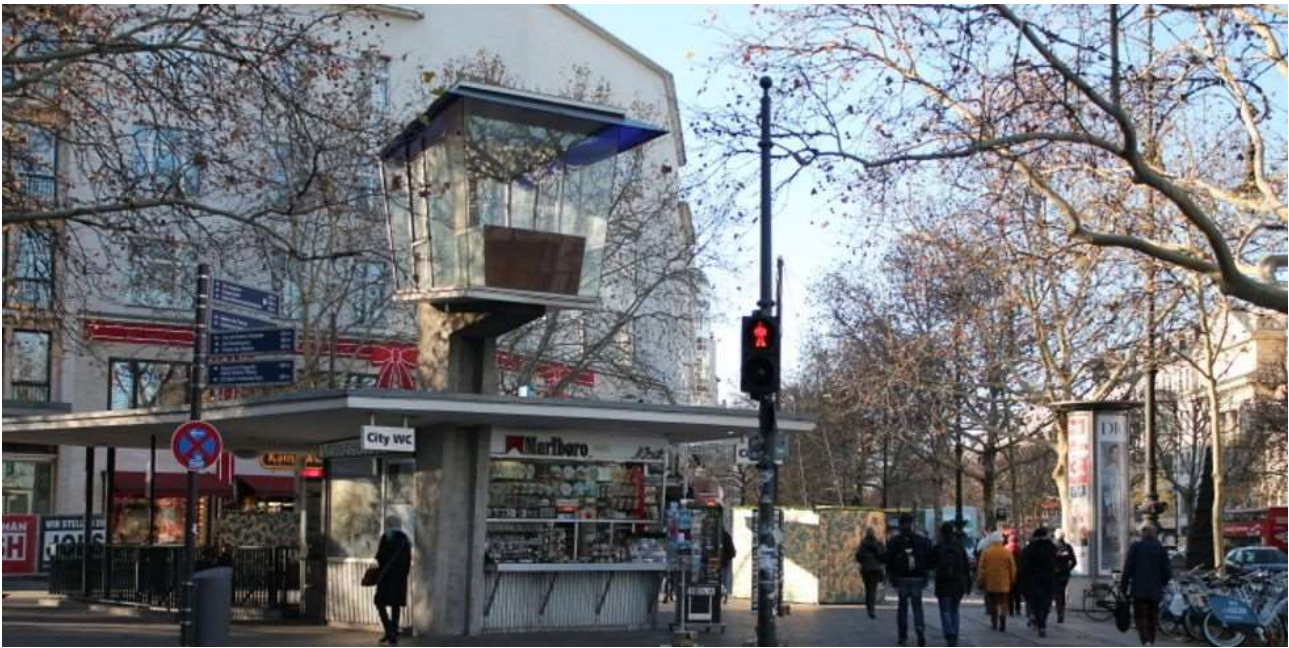
Der Joachimsthaler Platz soll umbenannt werden.