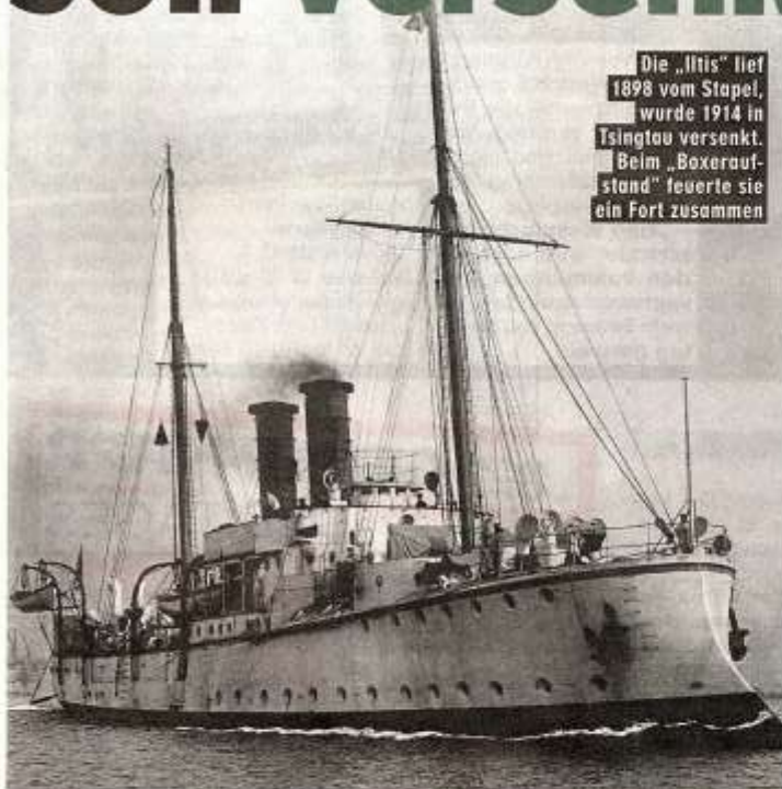
Die „Iltis“ lief 1898 vom Stapel, wurde 1914 in Tsingtau versenkt. Beim „Boxeraufstand“ feuerte sie ein Fort zusammen