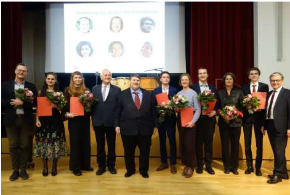
Gruppenbild mit allen Preisträgern