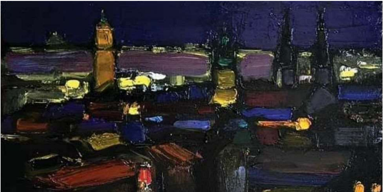
Ganna Kryvolap "Lviv unbreakable", 2022.