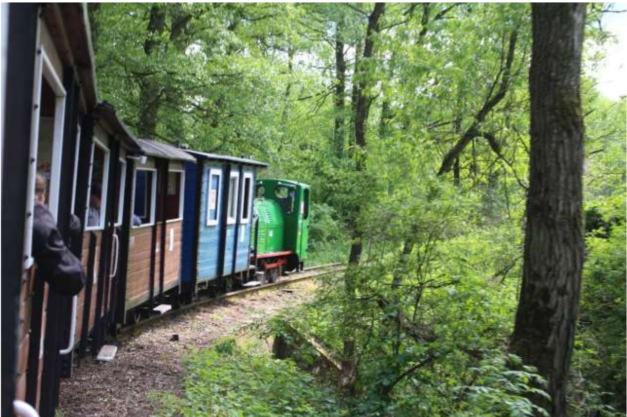
Weißenhöhe / poln. Bialosliwie, Fahrt mit der Kleinbahn

Aufnahme: Reinhard M. W. Hanke, 22.05.2022, 0838.