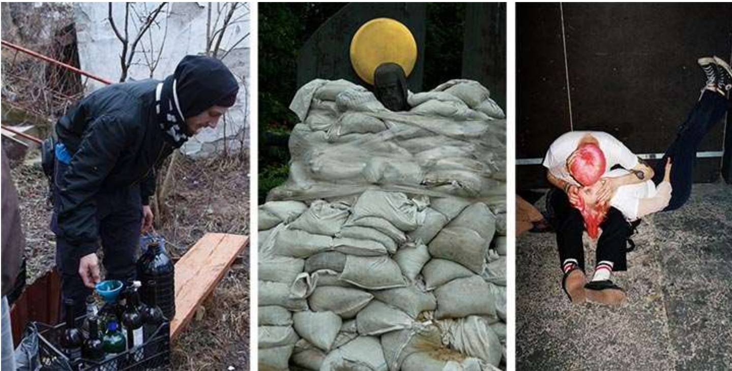
Fotograf*innen von li nach re: Ksenia Pavlova, Andriy Nedzelnytskyi, Lesha Berezovskiy, Tetiana Bohuslavska

Ausstellung vom 18. Januar bis 12. März 2023