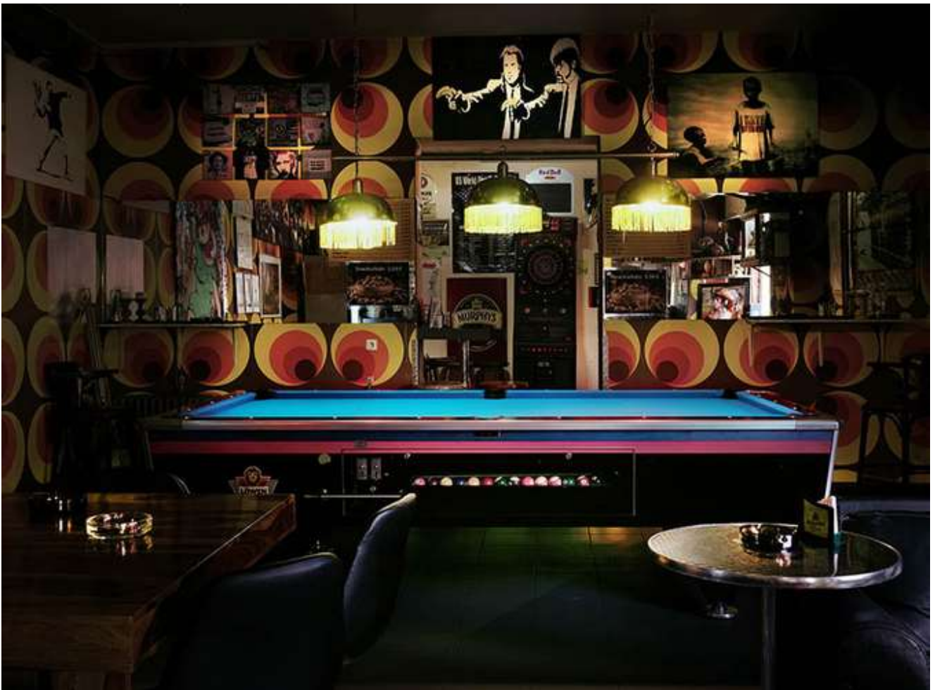
Mierendorffplatz, 2022.- © Anna Lehmann-Brauns, Fine Art Print