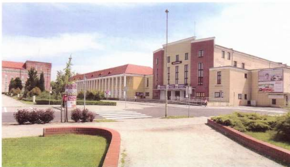
Danziger Platz heute