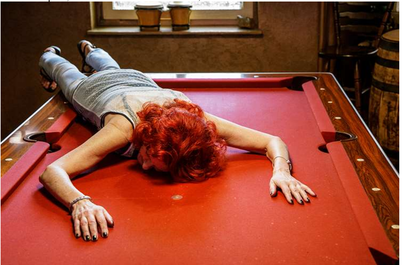
Chez Hardy, 2022.- © Stefanie Schweiger, Fine Art Print