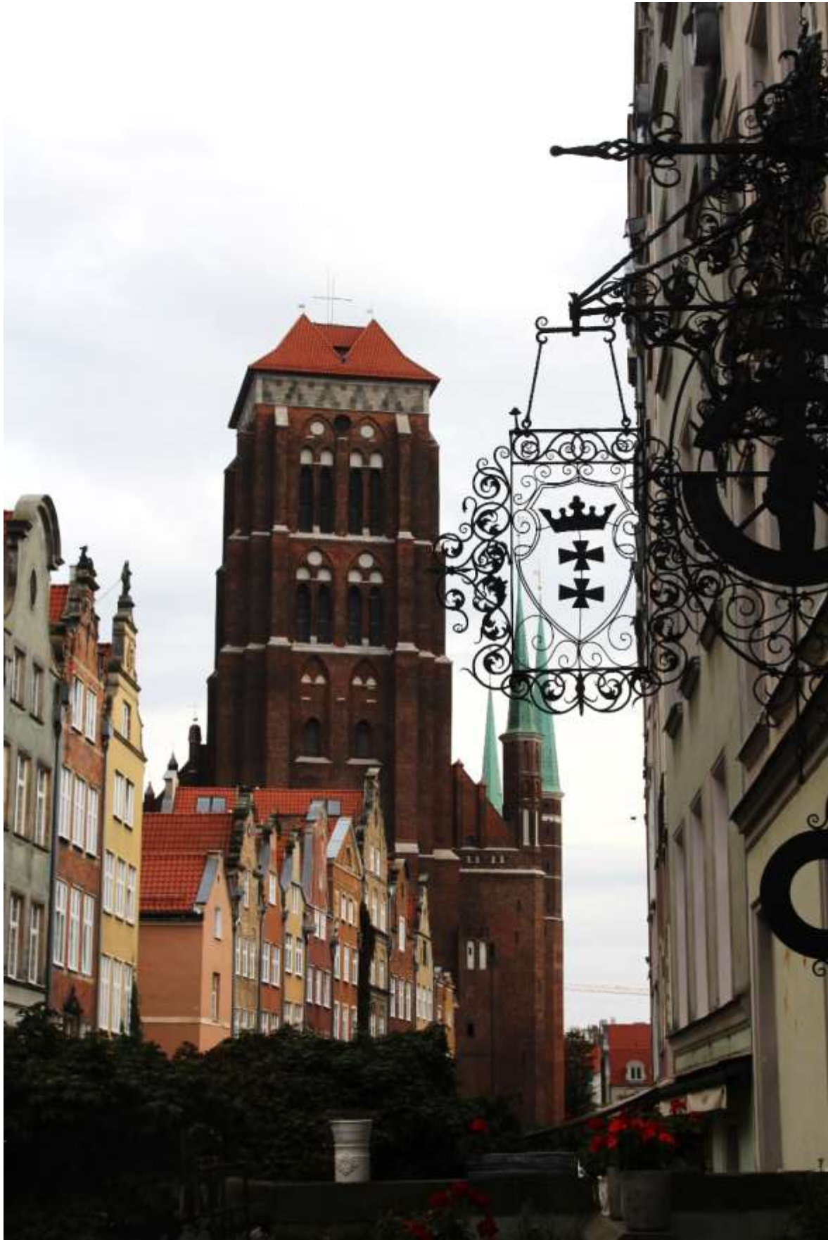
Danzig, Blick von Westen in der Brotbänkengasse auf die Marienkirche.