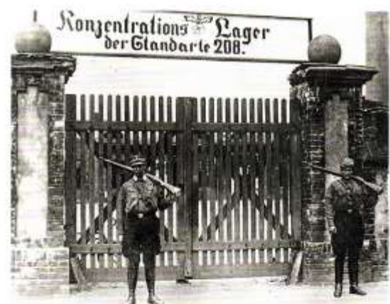
SA-Wachen vor dem Tor des KZ Oranienburg, Juni 1933