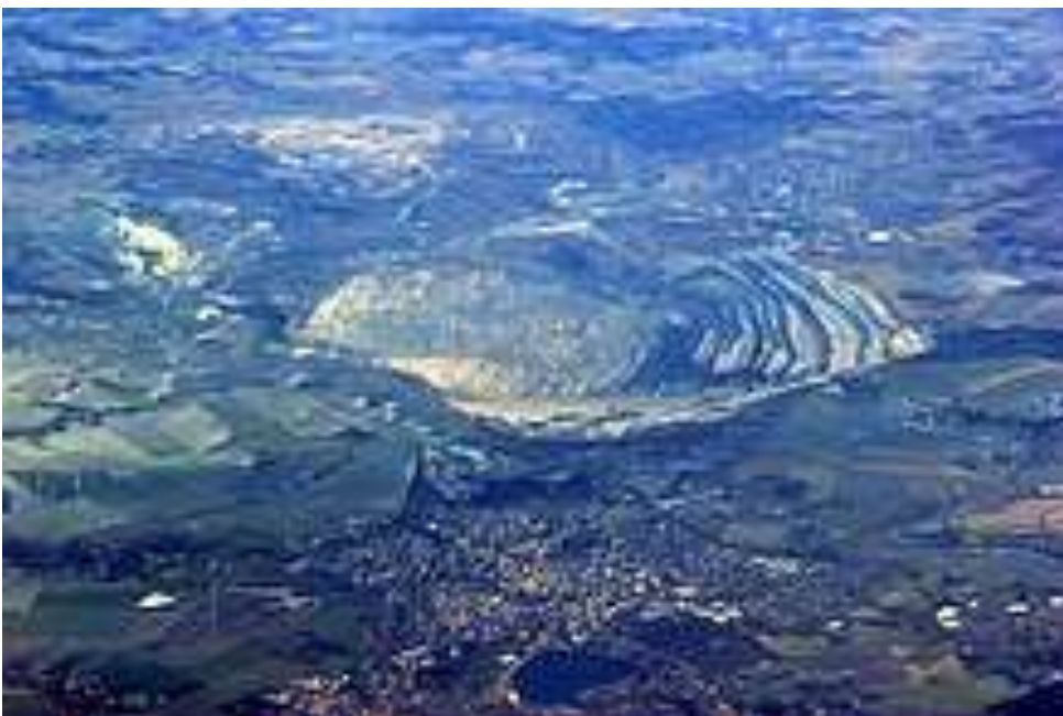
Luftaufnahme von Tagebau und Kraftwerk Turów mit Zittau am unteren Bildrand