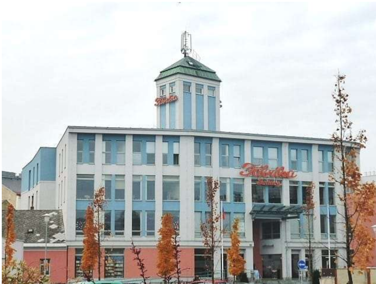
Kulturzentrum Fabrika in Svitavy