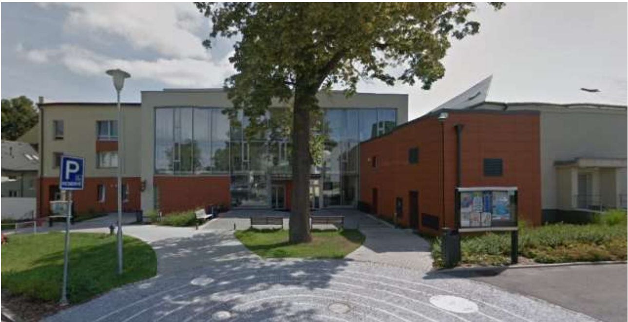
Kino Vesmír

„Für Kinder führen wir jeden zweiten Sonntag im Theater Trám ein Märchen auf. Dazu bieten wir Schulprogramme an. Jedes Wochenende werden zudem im Kino Vesmír Kinderfilme gezeigt. Diese Vorstellungen sind besser besucht.“