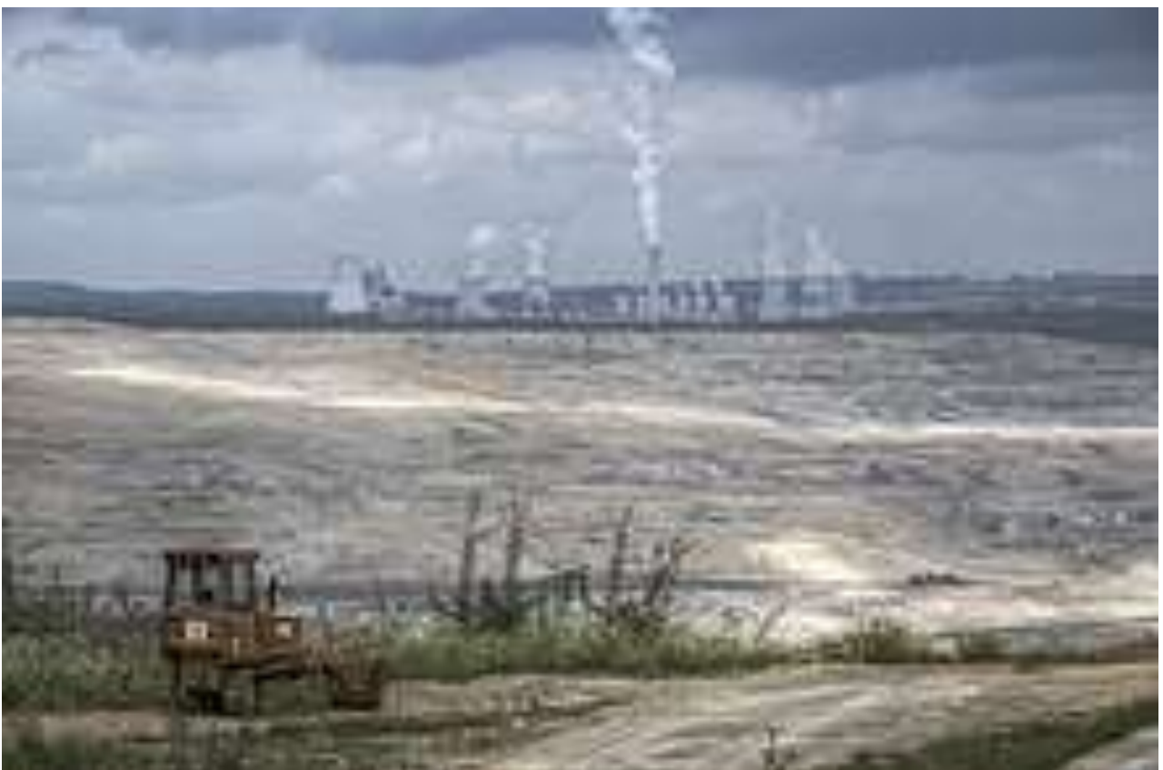
Tagebau Turów und Kraftwerk