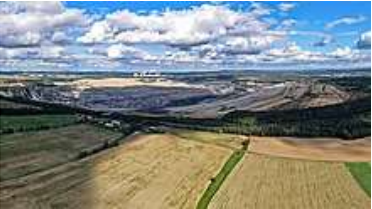
Tagebau-Gesamtansicht von Süden

Der Tagebau Turów , offiziell PGE Górnictwo i Energetyka Konwencjonalna S.A., Oddział KWB Turów , ist ein Braunkohlengroßtagebau im Südwesten von Polen . Er befindet sich östlich der Lausitzer Neiße auf dem Gebiet der Gemeinde Bogatynia (Reichenau in Sachsen). Betreiberin ist die Polska Grupa Energetyczna .