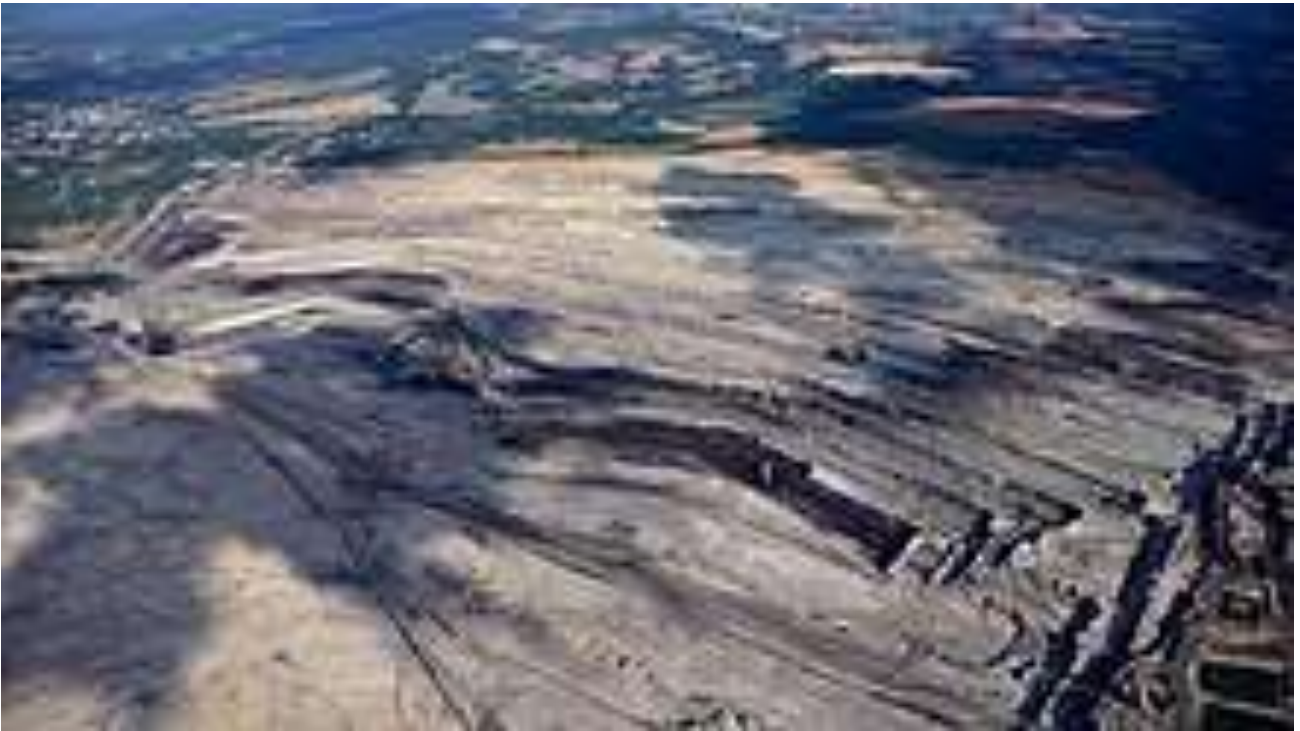
Tagebau Turów, Luftaufnahme (2019)