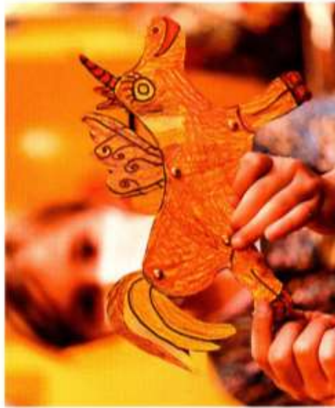
Offenes Atelier im Jugend Museum

Offenes Atelier Basteln, spielen, werken für die ganze Familie