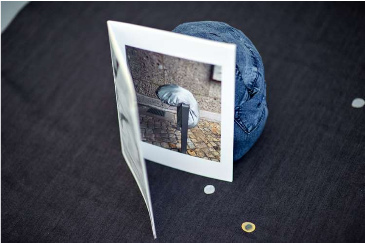
Birgit Szepanski, Mirroring City , 2021, Installation (Ausschnitt), Künstlerheft des Helene Nathan Verleges