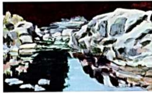
Ausstellung Palmenschatten im Haus am Kleistpark, siehe S. 49

Telefon 030-90 277 4527 projekt@wirwarennachbarn.de www.wirwarennachbarn.de