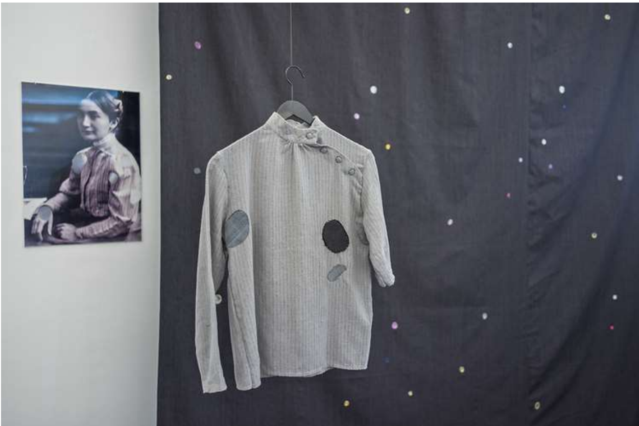
Birgit Szepanski, Mirroring City, 2021, Installation (Ausschnitt) aus einem Vorhang (mit Kaugummi), Collage mit einer Archivfotografie Helene Nathans (Museum Neukölln), textilen Objekten und Künstlerheften des Helene Nathan Verlages