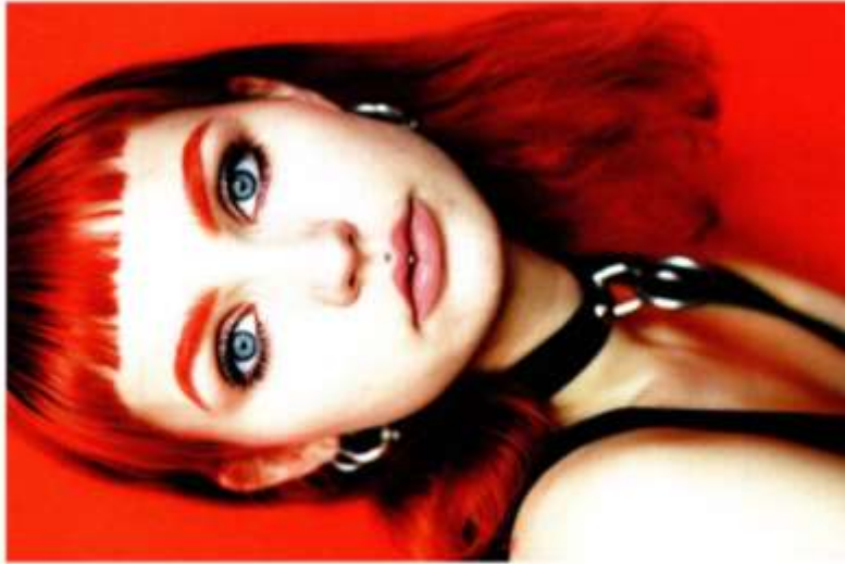
© Birgit Klüber, »Modern Queens #10«, 2019