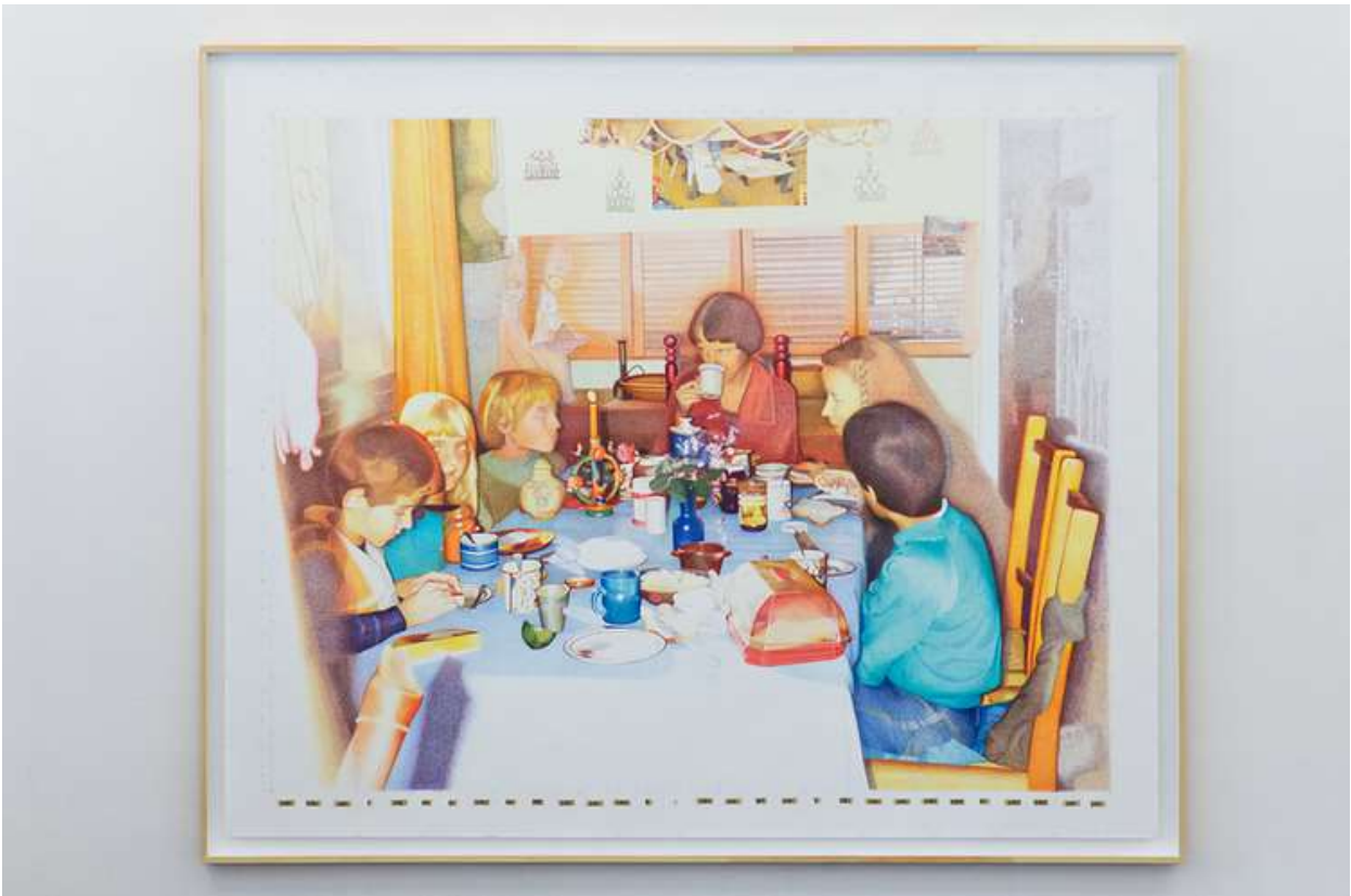
Olaf Kühnemann, Grid References, 2020/2021, Buntstiftzeichnung auf Papier