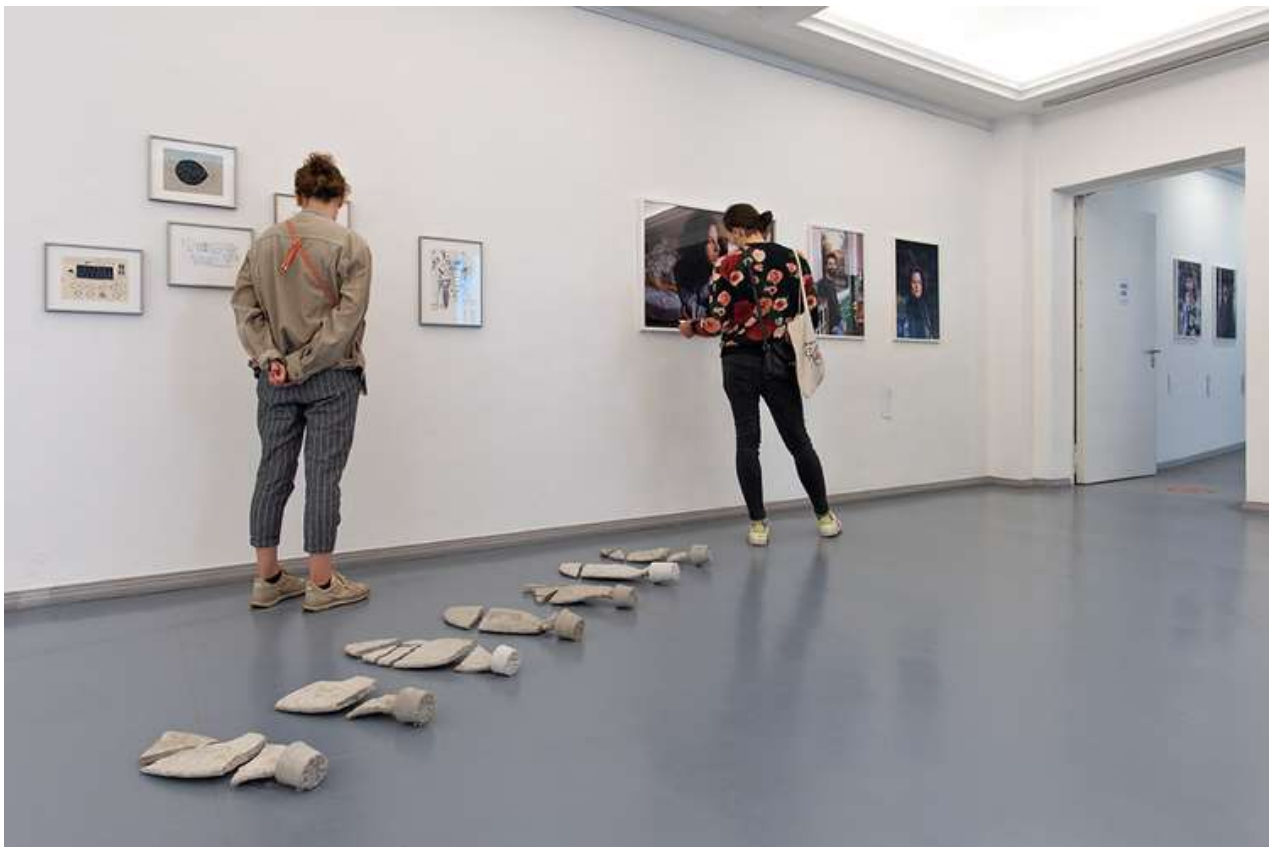
Michal Fuchs, Disillusionment, 2021, Betonskulpturen auf dem Boden, Ausstellungsansicht