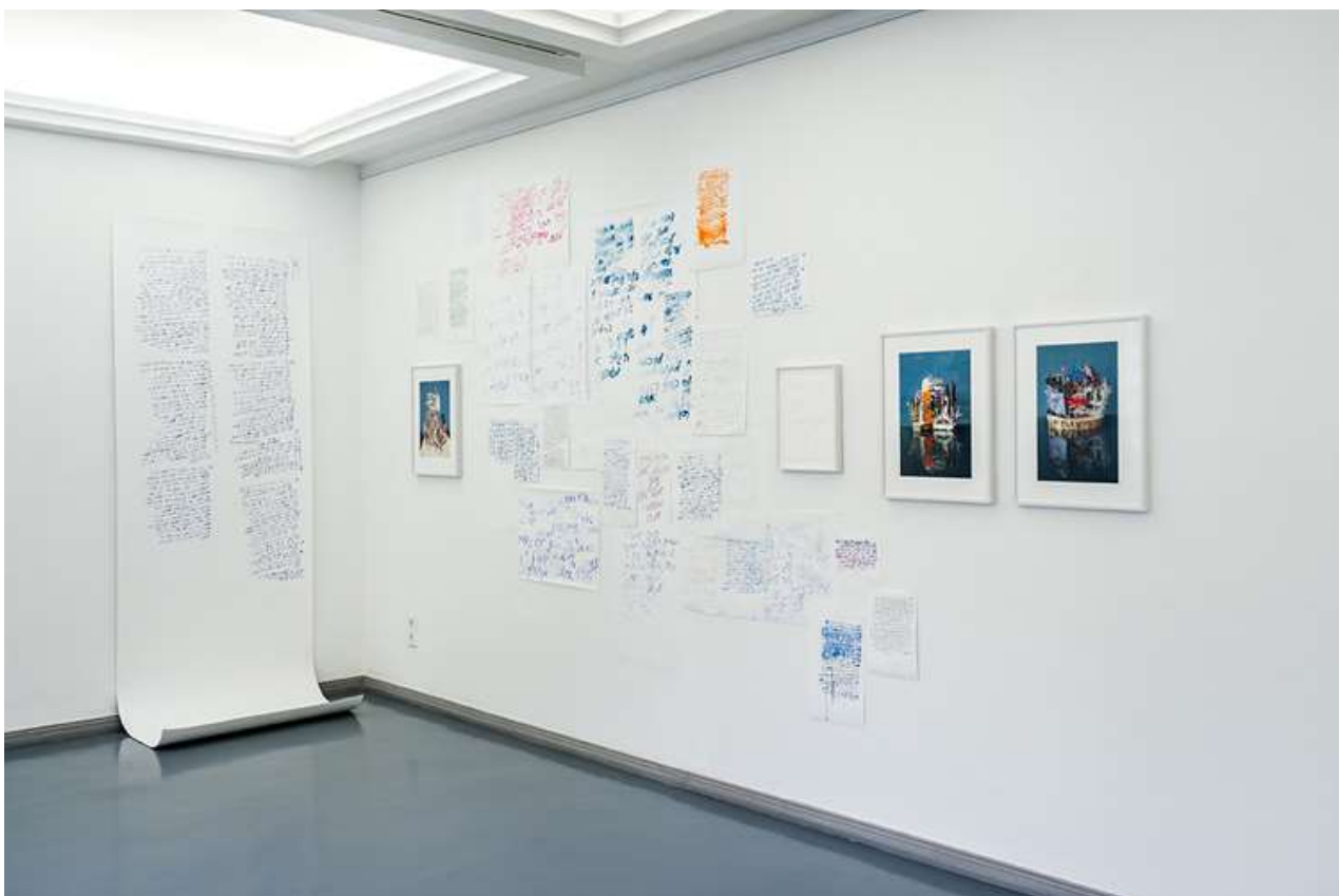
Atalya Laufer, Ohne Titel (aus der Serie Yaakov), 2021, Wandinstallation mit von ihr gezeichneten Texten des Bildhauers Ben Yaakov, (Archiv Kibbuz Hazorea, Israel) und Fotografien aus einer gleichnamigen Fotografieserie von 2015