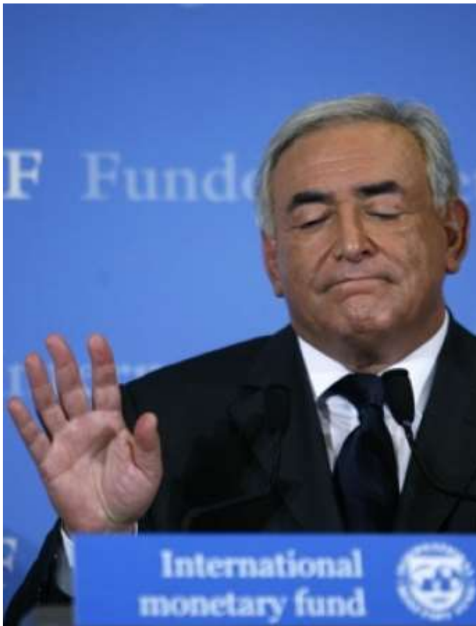
Dominique Straus-Kahn

Die neue journalistische Untersuchung des International Consortium of Investigative Journalists deckt den Reichtum auf, den Tausende von einflussreichen Personen auf der ganzen Welt in Steuerparadiesen verstecken. Es sind 35 Staats- und Regierungschefs, Banker, Minister, Parteiführer, Parlamentarier, aber auch Generäle, Geheimdienstchefs, öffentliche und private Manager, Banker und Industrielle, Sänger und Prominente aller Art, die alle zur Spitze des universellen guten Gewissens gehören.