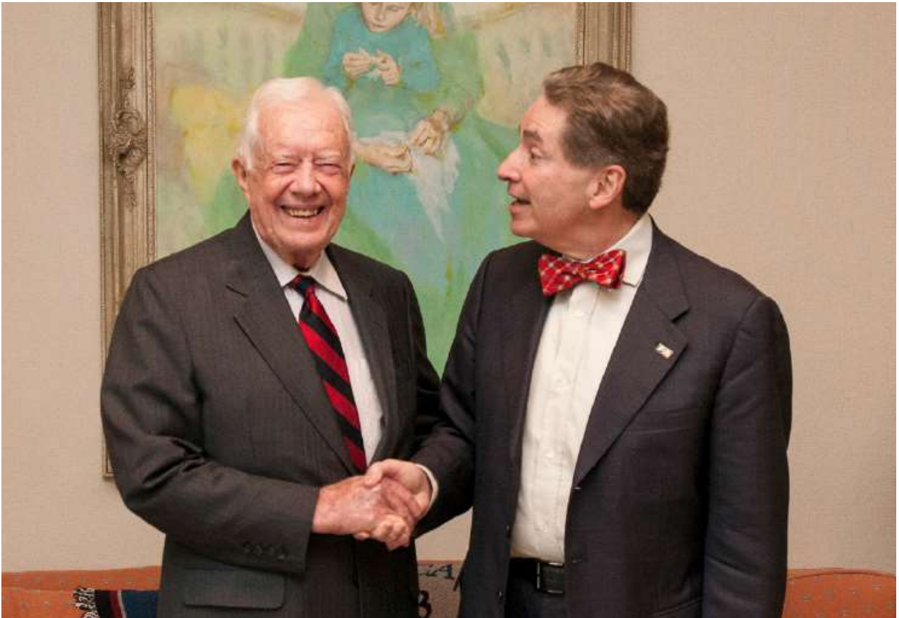
Präsident Carter mit dem Autor