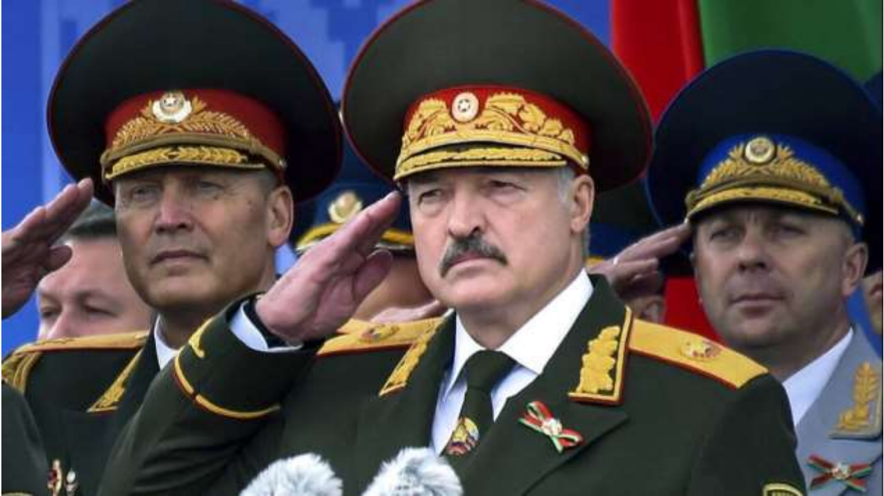
Alexander Lukaschenko