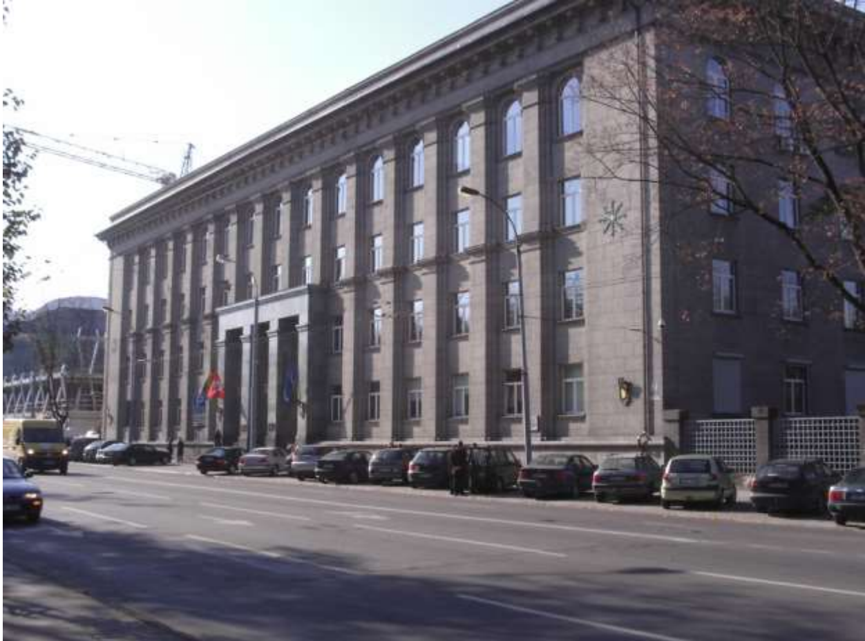
Litauisches Außenministerium

Litauischen Presseberichten zufolge wurden bei einem Cyberangriff auf das Außenministerium sensible Daten aus dieser Einrichtung gehackt .