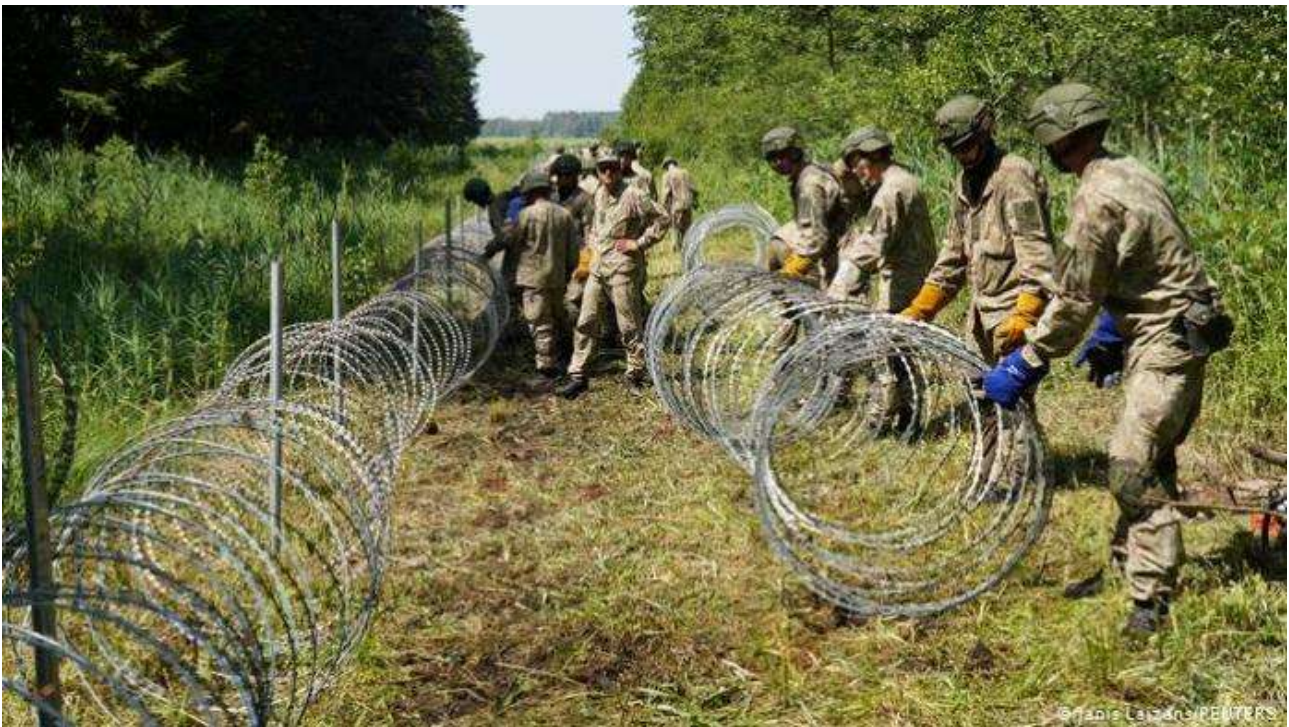
Litauische Soldaten errichten Stacheldraht an der Grenze zu Weißrussland

Die Präsidentin der Europäischen Kommission, Ursula von der Leyen, besuchte die litauische Hauptstadt und sicherte die Unterstützung der EU zu. Diese Unterstützung erfolgte in Form von 36,7 Millionen Euro „zur Erhöhung der Aufnahmekapazität für eine große Zahl von Migranten“, d. h. Geld für medizinische Versorgung, Impfungen, Kleidung und Lebensmittel in den Ausländerzentren, in denen es bereits letzte Woche zu einem Aufstand irakischer Migranten kam. Andererseits hat die Europäische Agentur für Grenz- und Küstenschutz, Frontex, einige Experten und modernste Ausrüstung geschickt. Es sei daran erinnert, dass Frontex Ungarn im Januar verlassen hat, nachdem eine Nichtregierungsorganisation, das Helsinki-Komitee, – natürlich die Open Society von George Soros -, die Regierung von Viktor Orbán angeprangert hatte, weil sie illegale Migranten nach Serbien zurückgeschickt hatte. Wir werden also sehen, wie lange diese Unterstützung anhält. Auf die Bitte der litauischen Regierung um finanzielle Unterstützung für den Bau des Grenzzauns hat die Europäische Kommission geantwortet, dass sie „keine Zäune finanziert, sondern integrierte Grenzkontrolllösungen unterstützt“.