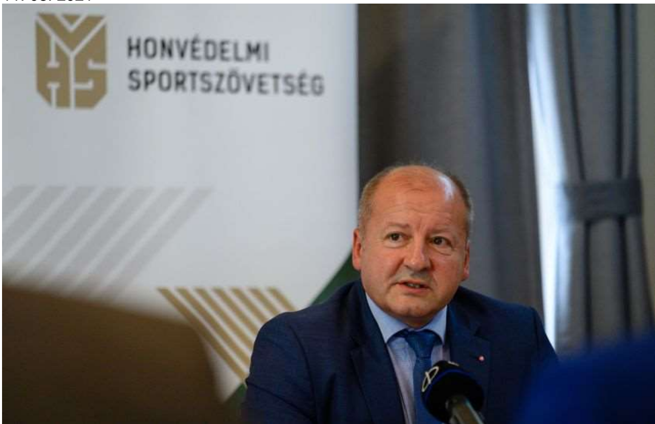
István Simicskó

Es sind neue virtuelle Kriegsschauplätze entstanden, auf denen die ungarische Regierung bereits unter Dauerbeschuss durch schockierende Fake News steht, so István Simicskó, Parlamentsabgeordneter und Fraktionsvorsitzender der Christlich-Demokratischen Volkspartei (KNDP), in einem Interview mit dem Portal Vasárnap.hu zu den Parlamentswahlen im nächsten Jahr.