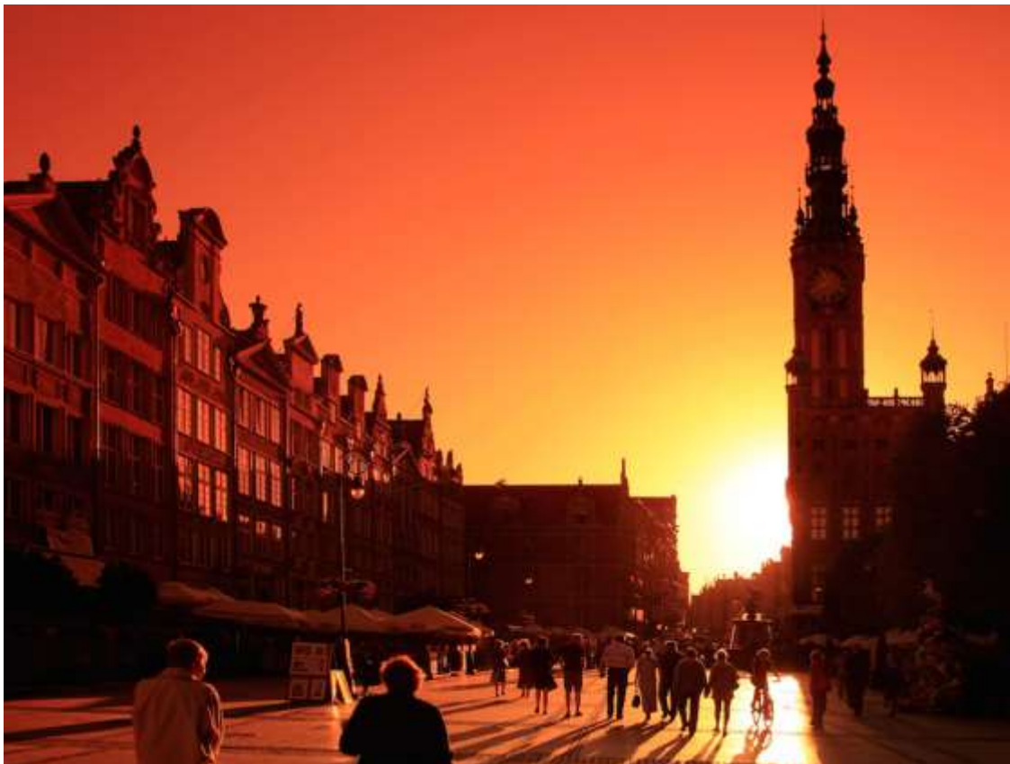
Der Lange Markt in Danzig.

Den Abschluss unserer kleinen Reihe bildet am 14. Oktober eine weitere Diareportage. Diesmal nehmen das Museum und das Kulturreferat für Westpreußen, Posener Land und Mittelpolen Sie mit auf eine Reise in eine andere ehemals preußische Provinz: Schlesien.