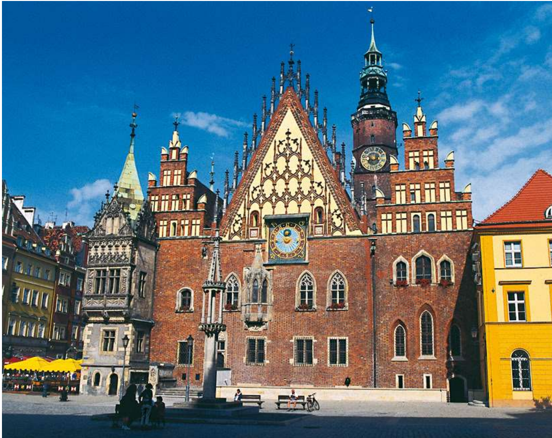
Das Rathaus in Breslau.

Das hintere Pommern bildet den Ausgangspunkt der Dia-Reportage des Berliner Journalisten und Fotografen Roland Marske. Die Reise führt von Stettin entlang der Ostsee an die untere Weichsel, in die ehemalige preußische Provinz Westpreußen mit seiner Hauptstadt, dem tausendjährigen Danzig.