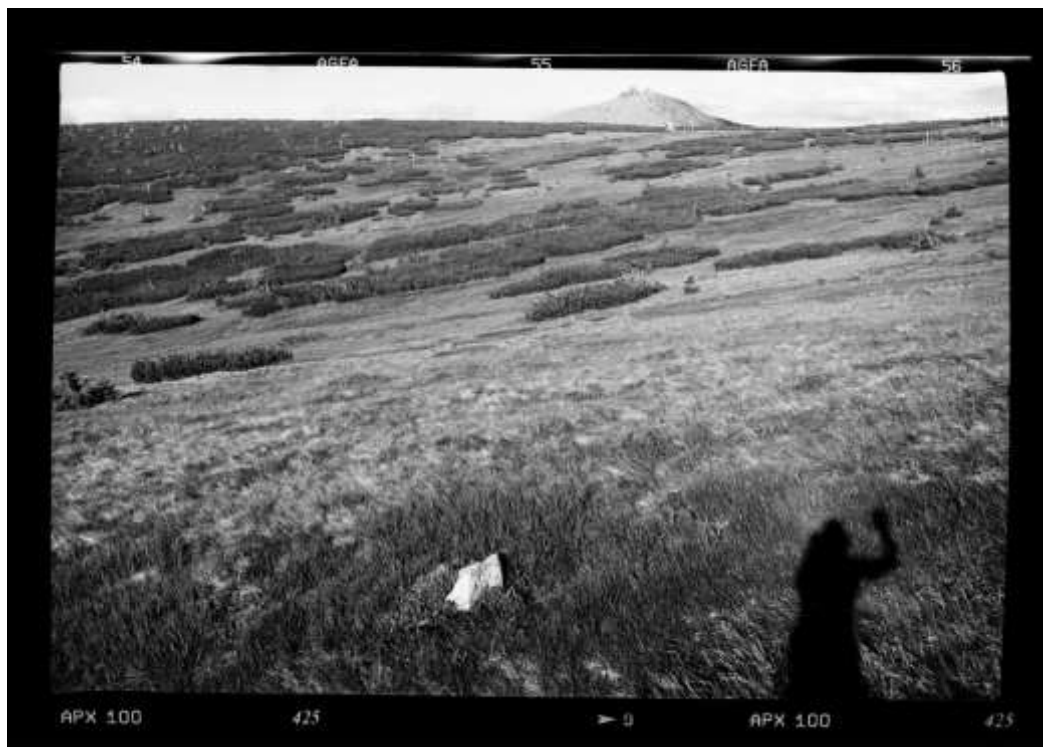
Schneekoppe, Fotografie und © Jacek Jaśko