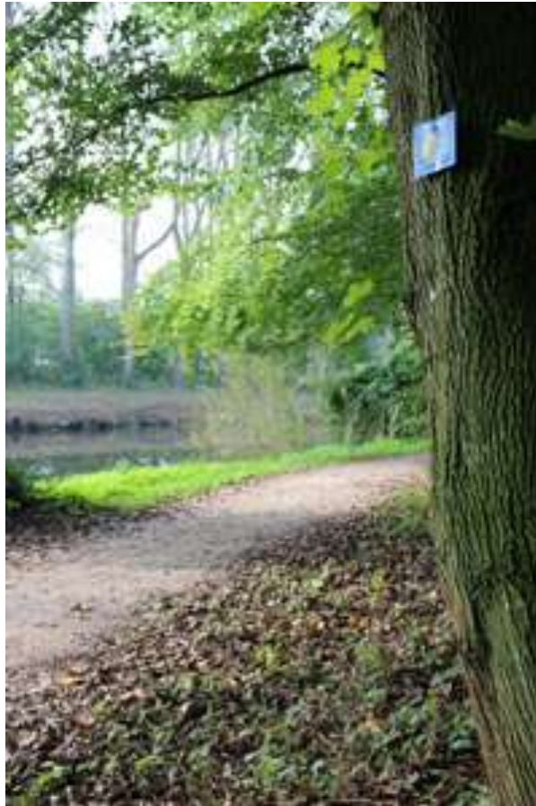
Pilgerweg in Warendorf.

Die Archäologin Ulrike Steinkrüger führt das Publikum auf historischen Wegen in eine ganz spezielle Art des Reisens ein: das Pilgern. Am Beispiel der Wege, die mittelalterliche Jakobspilger*innen nach Santiago de Compostela durch Westfalen genutzt haben, kommen auch zahlreiche Spuren zutage, die die Pilgernden damals hinterlassen haben. Wie sahen solche Wege im Mittelalter eigentlich aus? Und wie können sie rekonstruiert werden? Innerhalb eines Projekts der Altertumskommission für Westfalen (LWL) hat Ulrike Steinkrüger dies jahrelang erforscht und für heutige Pilgernde wieder sichtbar gemacht. Auch Warendorf ist seit 2015 an das Netz der europäischen Jakobswege angeschlossen. Also machen auch Sie den Weg zu Ihrem Ziel und begeben Sie sich mit uns auf die Spuren mittelalterlicher Jakobspilger*innen durch Westfalen.