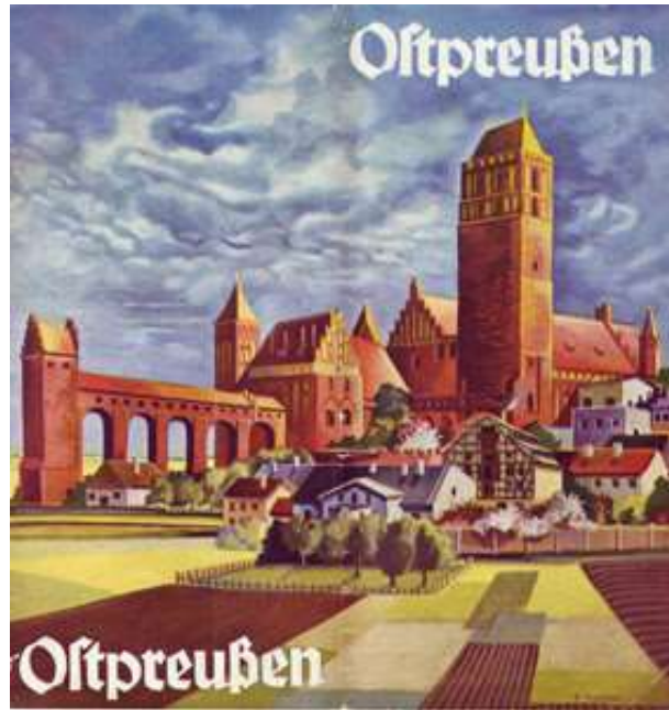
Reiseprospekt Ostpreußen.

Erst im ausgehenden 18. Jahrhundert begann man, andere Regionen und weiter entfernt liegende Orte wegen ihrer Geschichte, Bauwerke, Bibliotheken usw. zu besuchen. Diesen „Gelehrten-Reisen“ gesellten sich im 19. Jahrhundert Erholungsreisen hinzu, die zunehmend auch nach Ostpreußen führten. Der Erste Weltkrieg bildete eine Zäsur, doch in den 1920er und 1930er Jahren entwickelte sich der Tourismus zu einer wichtigen Einnahmequelle im geographisch abgetrennten und v.a. landwirtschaftlich geprägten Ostpreußen.