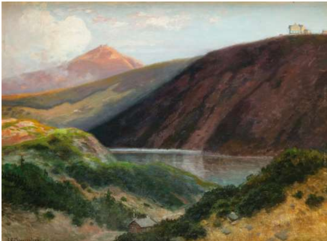
Carl Ernst Morgenstern (1847–1928): Der große Teich im Riesengebirge, um 1920