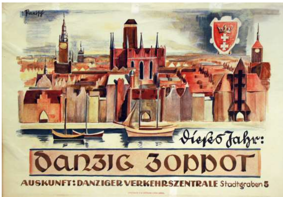
Plakat „Dieses Jahr Danzig Zoppot“. Farbdruck von Bruno Paetsch, Danzig o. J. (1930er Jahre).

Reisen – der Deutschen liebstes Hobby. Jahrzehntlang war der Tourismus zudem ein stetig wachsender Wirtschaftszweig – allein 2019 unternahmen die Deutschen insgesamt 70,1 Millionen Urlaubsreisen – bis die Corona-Pandemie dieser Entwicklung 2020 und 2021 erst langsam, dann umfassend ein Ende bereite. Aber das Reisen an sich war auch in vergangenen Zeiten durchaus schon ein Massenphänomen – wenn auch oft aus anderen Gründen als heute.