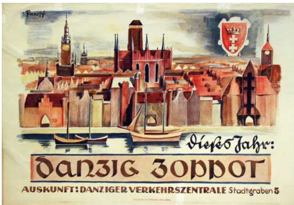
Plakat „Dieses Jahr Danzig Zoppot“. Farbdruck von Bruno Paetsch, Danzig o. J. (1930er Jahre).

Reisen – der Deutschen liebstes Hobby. Jahrzehntlang war der Tourismus zudem ein stetig wachsender Wirtschaftszweig – allein 2019 unternahmen die Deutschen insgesamt 70,1 Millionen Urlaubsreisen – bis die Corona-Pandemie dieser Entwicklung 2020 und 2021 erst langsam, dann umfassend ein Ende bereitere. Aber das Reisen an sich war auch in vergangenen Zeiten durchaus schon ein Massenphänomen – wenn auch oft aus anderen Gründen als heute.