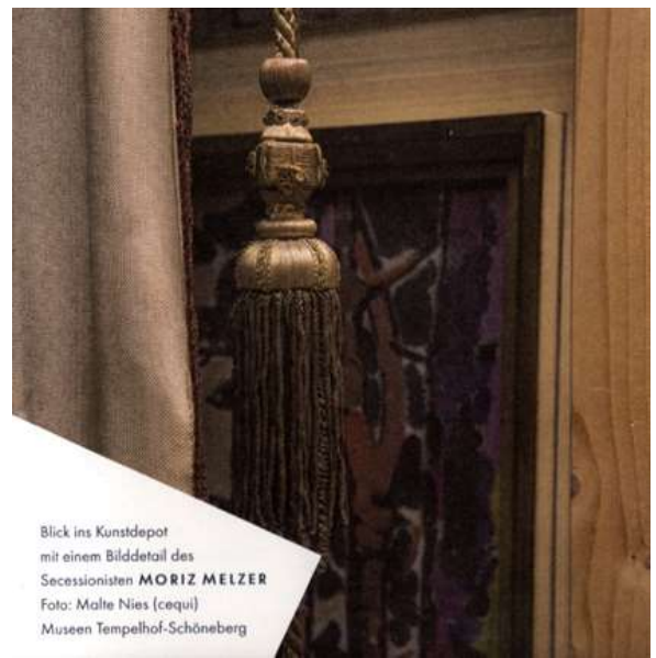
Blick ins Kunstdepot mit einem Bilddetail des Secessionisten MORIZ MELZER