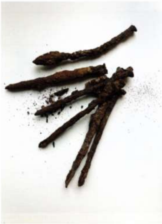
Verrostete Nägel vom Tempelhofer Feld, 2021