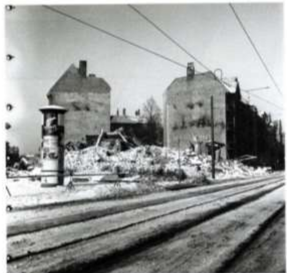
Trümmer auf dem Gelände der Thorwaldsenstraße 1-2, 10. Januar 1954, Foto: Herwarth Staudt

Zu entdecken auf www.museum-digital.de www.deutsche-digitale-bibliothek.de