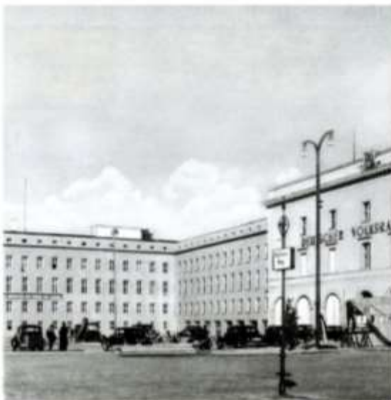
Thälmannplatz, Berlin, 1949, Foto: Schumann (Postkartendetail)

Ort: Informationsort Schwerbelastungskörper, General-Pape-Straße / Loewenhardtdamm, 12101 Berlin.