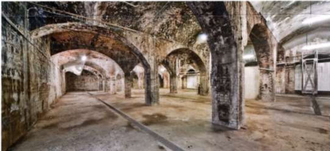
Ehem. Gärkeller der Bockbrauerei, Kreuzberg, 2018

Unterirdische Rüstungsproduktion der Firma Telefunken 1944/45