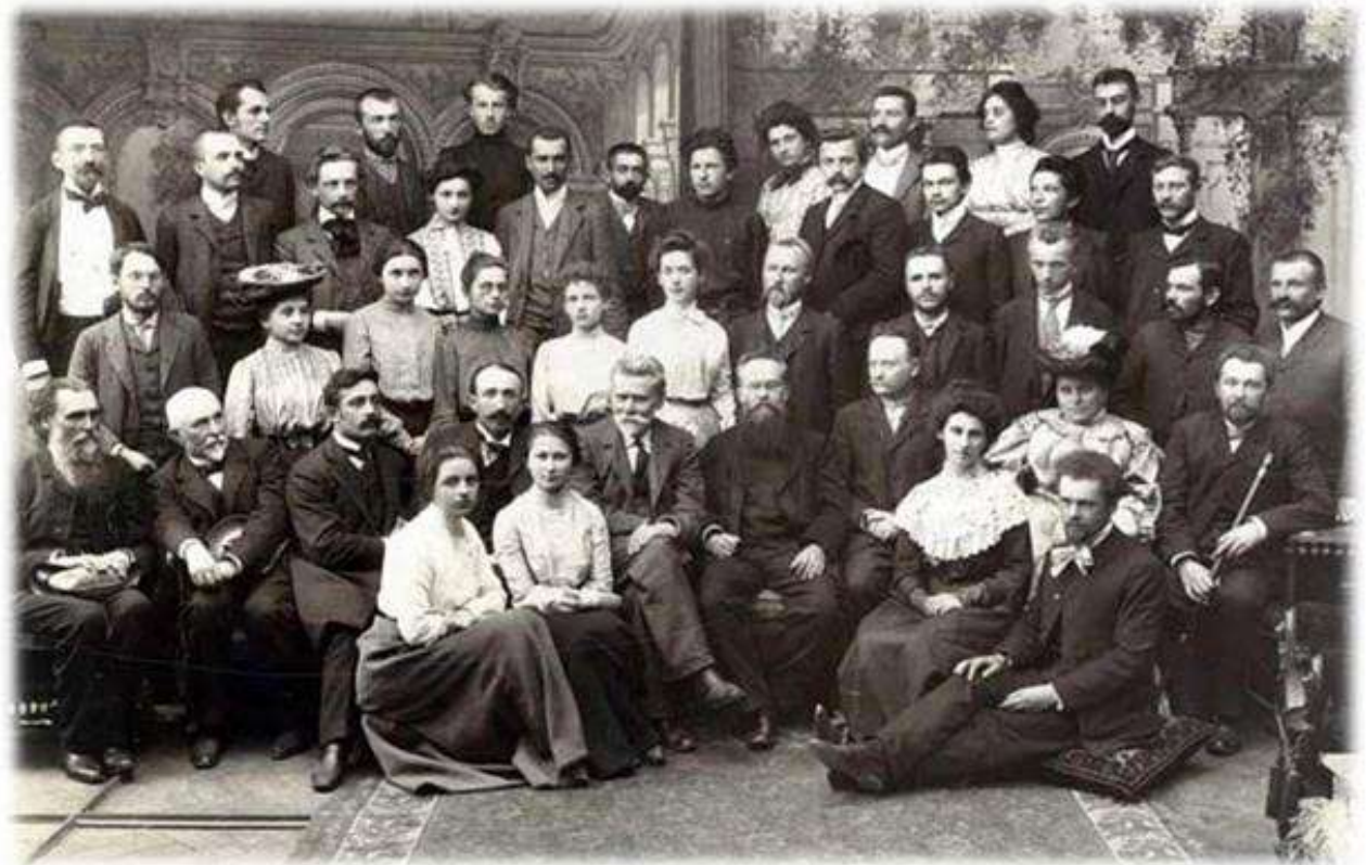
Abbildung: Wissenschaftliche Ferienkurse 1904