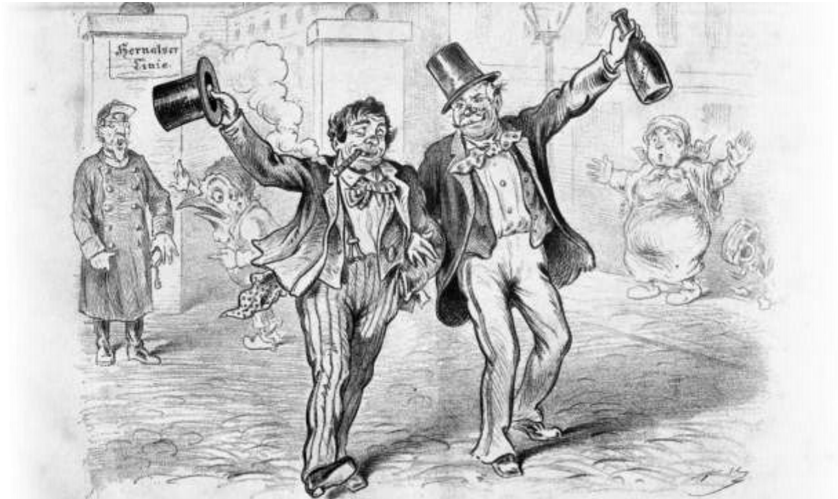
Titelblatt des »Humoristischen Volksblatts« Kikeriki! vom 30. Januar 1879 (Ausschnitt, Bildbeschreibung: s.u.). Abbildung: © Österreichische Nationalbibliothek, ANNO 14. Januar 2021

Das Zentrum für Historische Forschung Berlin der Polnischen Akademie der Wissenschaften – ZFH lädt in Kooperation mit dem Aleksander-Brückner-Zentrum für Polenstudien in Halle und dem Deutschen Kulturforum für östliches Europa in Potsdam zum Klaus-Zernack-Colloquium 2021 ein.