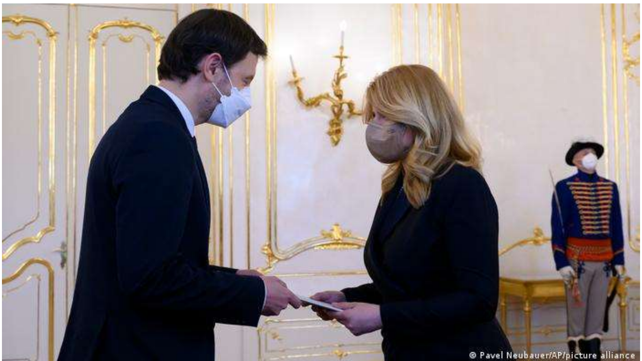
Staatspräsidentin Zuzana Caputova ernennt Eduard Heger zum Ministerpräsidenten

Der vorherige konservativ-populistische Ministerpräsident Igor Matovic hatte Finanzminister Eduard Heger als seinen Nachfolger vorgeschlagen. Dessen Posten übernimmt jetzt Matovic.