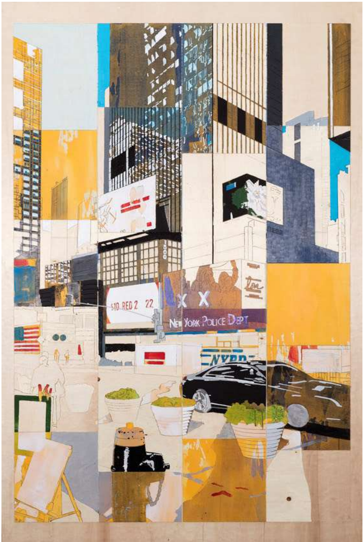
Detlef Waschkau, Queens - Manhattan, 2020, Pigment auf Holz