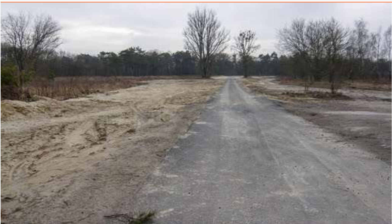
Standort des abgerissenen „Atelierhaus Panzerhalle“, Groß Glienicke, 2012.

https://www.kommunalegalerie-berlin.de/index.php?id=351 .