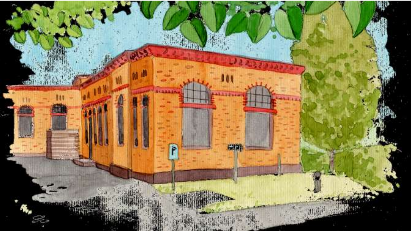
Bild: Unser Dienstsitz in Potsdam in den einstigen Ställen der ehemaligen Garde du Corps-Kaserne. Aquarell: Ulrike Niedlich, 2019