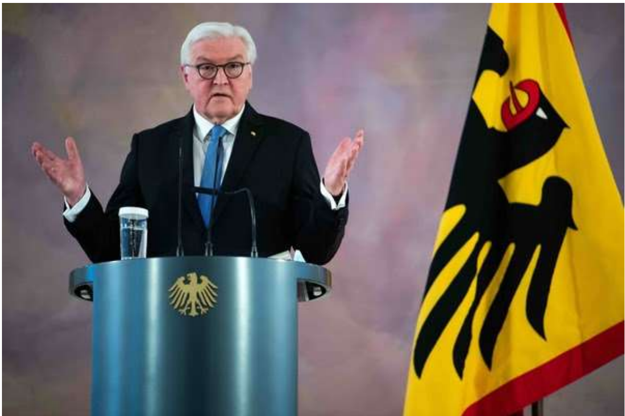
Bundespräsident Steinmeier bei seiner gestrigen Ansprache zum 150. Jahrestag der Reichsgründung

„Einen ungetrübten Blick auf das Kaiserreich vorbei am Völkermord, an zwei Weltkriegen und einer von ihren Feinden zerstörten Republik, gibt es nicht. Es kann ihn nicht geben“, um kaum ein positives Haar an der großen Leistung der Gründer des deutschen Nationalstaates zu lassen.