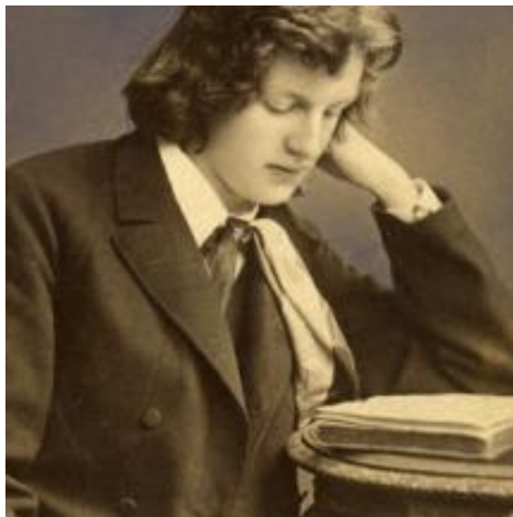
Gerhart Hauptmann 1885