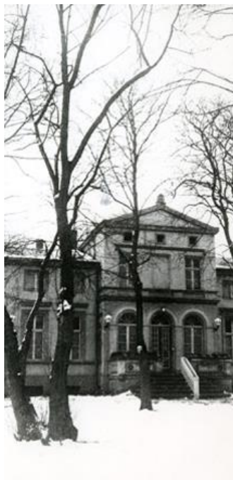
Die Villa Lassen um 1930