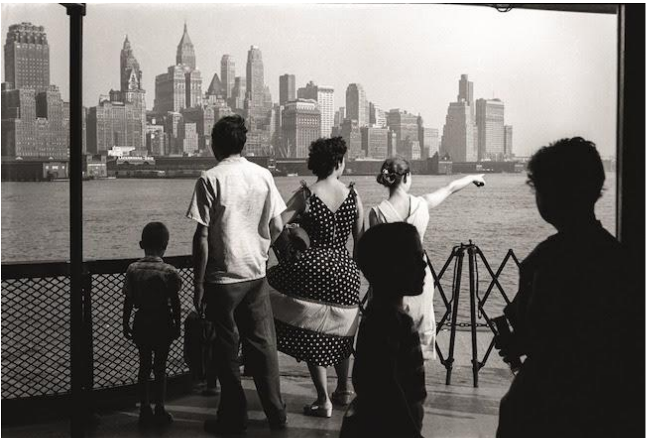
Vilmos Zsigmond: Manhattan I, New York, USA, 1974

Mittwoch, den 12. Februar 2020, 18:00 Uhr Collegium Hungaricum Berlin, Dorotheenstraße 12, 10117 Berlin